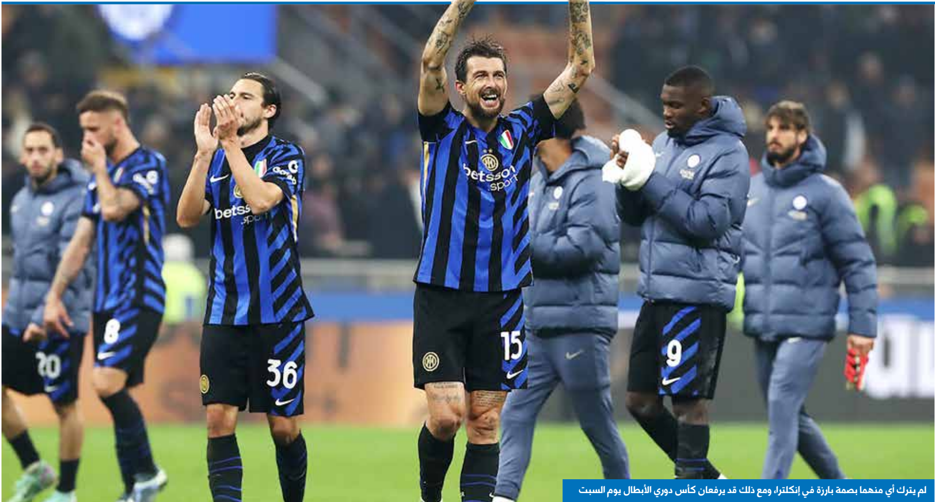
لم يترك أي منهما بصمة بارزة في إنكلترا، ومع ذلك قد يرفعان كأس دوري الأبطال يوم السبت

3-4-3، وأدخل لاعب رقم 10 في خطة 2-4-1-3. دخل فيتينيا، الماهر تقنياً، لكنه لم يكن مناسباً لدور هجومي، على عكس ما نراه اليوم من تمريرات متقنة وتحكم في نسق اللعب في سان جيرمان. نونو لم يكن غافلاً عن موهبة فيتينيا، مؤكداً أنه قد يتفوق حتى على موتينيو، لكنه احتاج إلى الوقت والتطور البدني، ومع استمرار وجود موتينيو، لم يكن هناك مكان. وأضاف نونو: «عليه تحسين الكثير من الجوانب البدنية والمواجهات... وهي أشياء تتطلب وقتاً للتكيف». شارك أكثر في النصف الثاني من الموسم، وبدأ 3 مباريات متتالية في الشهر الأخير، لكنه بدأ يتأقلم حين انتهى الموسم. غادر نونو في أيار 2021، ما أضعف فرص شراء وولفرهامبتون لللاعب من بورتو مقابل 17 مليون جنيه. نونو كان سيدفع لإتمام الصفقة، لكن خليفته برونو لاجي لم يكن مهتماً. حتى أنه رفض الصفقة عينها في الشتاء، بعدما أثبت فيتينيا نفسه في بورتو. صفقة ندم عليها وولفرهامبتون، لكن فيتينيا لم يندم، كاشفاً عن تجربته في «مولينو»: «نضجت كثيراً، حتى خارج الملعب. تعلمت كيف تكون الحياة في ناب خارج بلدك ومنطقة الراحة. لو عاد بي الزمن، لما غيّرت شيئاً». من لاعب احتياطي في وولفرهامبتون إلى نبض وسط سان جيرمان والمنتخب البرتغالي خلال 4 سنوات. ونهاية بدوري الأبطال يوم السبت، يا لها من رحلة!