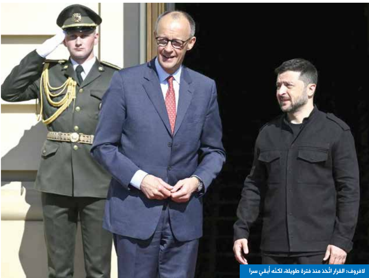
لافروف: القرار اتّخذ منذ فترة طويلة، لكنّه أبقيّ سرا

وأكد ماتياس ميرش، رئيس الكتلة البرلمانية للحزب: «نحن لا نريد أن نصبح طرفاً في الحرب، ولذلك رفضنا دائماً إرسال صواريخ «تاوروس». هذا لا يزال موقفنا». وقد أدرج الحزب حتى معارضته لتسليم هذا النظام ضمن برنامجه الرسمي الذي خاض به انتخابات شباط. واعتبر لارس كلينغبايل، وزير المالية وعضو بارز في الحزب الاشتراكي الديمقراطي، يوم الاثنين، أنّ تصريحات ميرتس لا تمثّل سياسة جديدة، ما يوحي بأنّ حربه لم يغيّر موقفه الرافض لتقديم هذا السلاح.