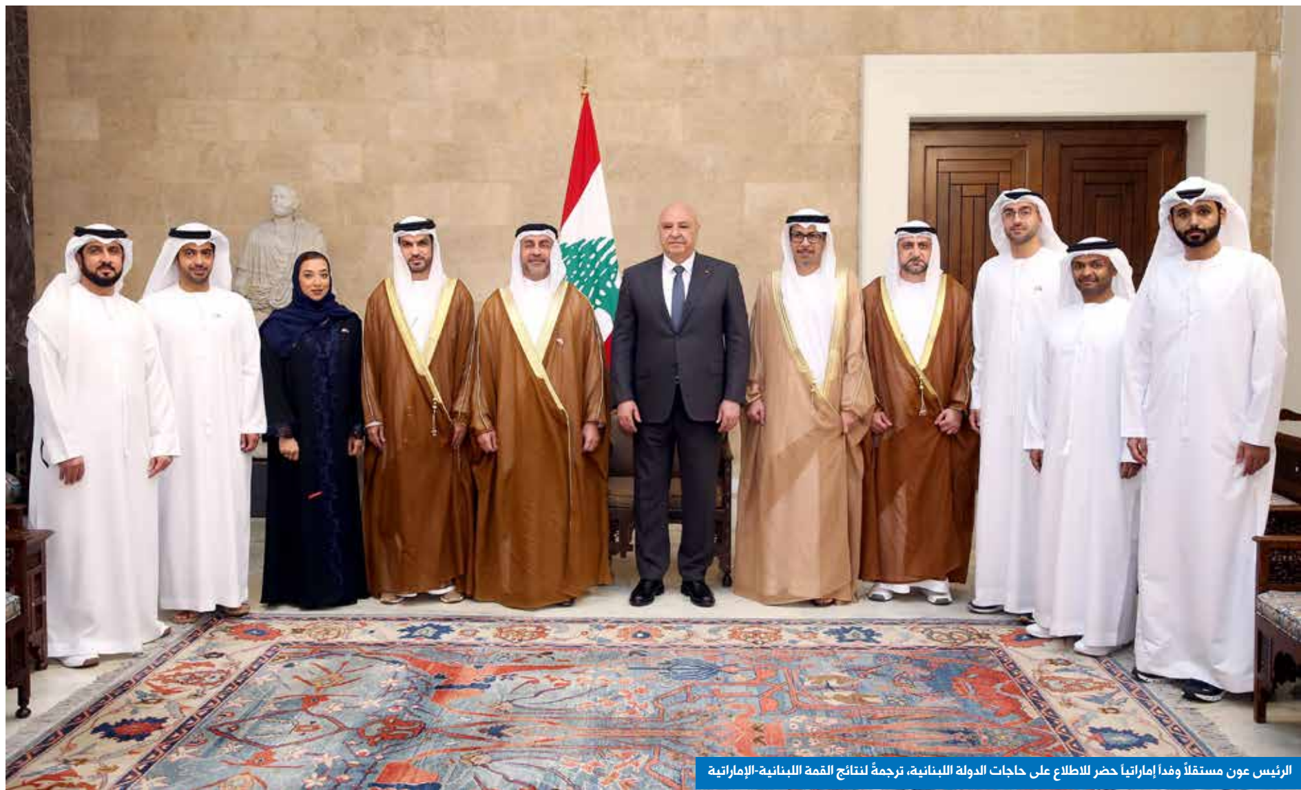
الرئيس عون مستقلاً وفداً إماراتياً حضر للاطلاع على حاجات الدولة اللبنانية، ترجمةً لنتائج القمة اللبنانية-الإماراتية

فيما لا يزال الوسط السياسي يقرأ في نتائج الانتخابات البلدية ومدى انعكاسها على الانتخابات النيابية المقررة السنة المقبلة، ارتفعت وتيرة الإنشغال بملف سلاح "حزب الله"، وجاءت المواقف التي أعلنها رئيس الحكومة نواف سلام من دبي حول ما سقاه "التحزّر من ثنائية السلاح وثنائية القرار"، لتنذر بهبوب عاصفة سياسية بينه وبين "الحزب"، قد تُبدّد ما هو متبق من وذ بينهما، وذلك بعدما كان رئيس الجمهورية العماد جوزاف عون قد اتفق مع الحزب على مناقشة ملف السلاح في أجواء هادئة بعيداً من أي تشنج، بالتزامن مع سعي حثيث لتثبيت وقف إطلاق النار وتنفيذ القرار الدولي 1701.