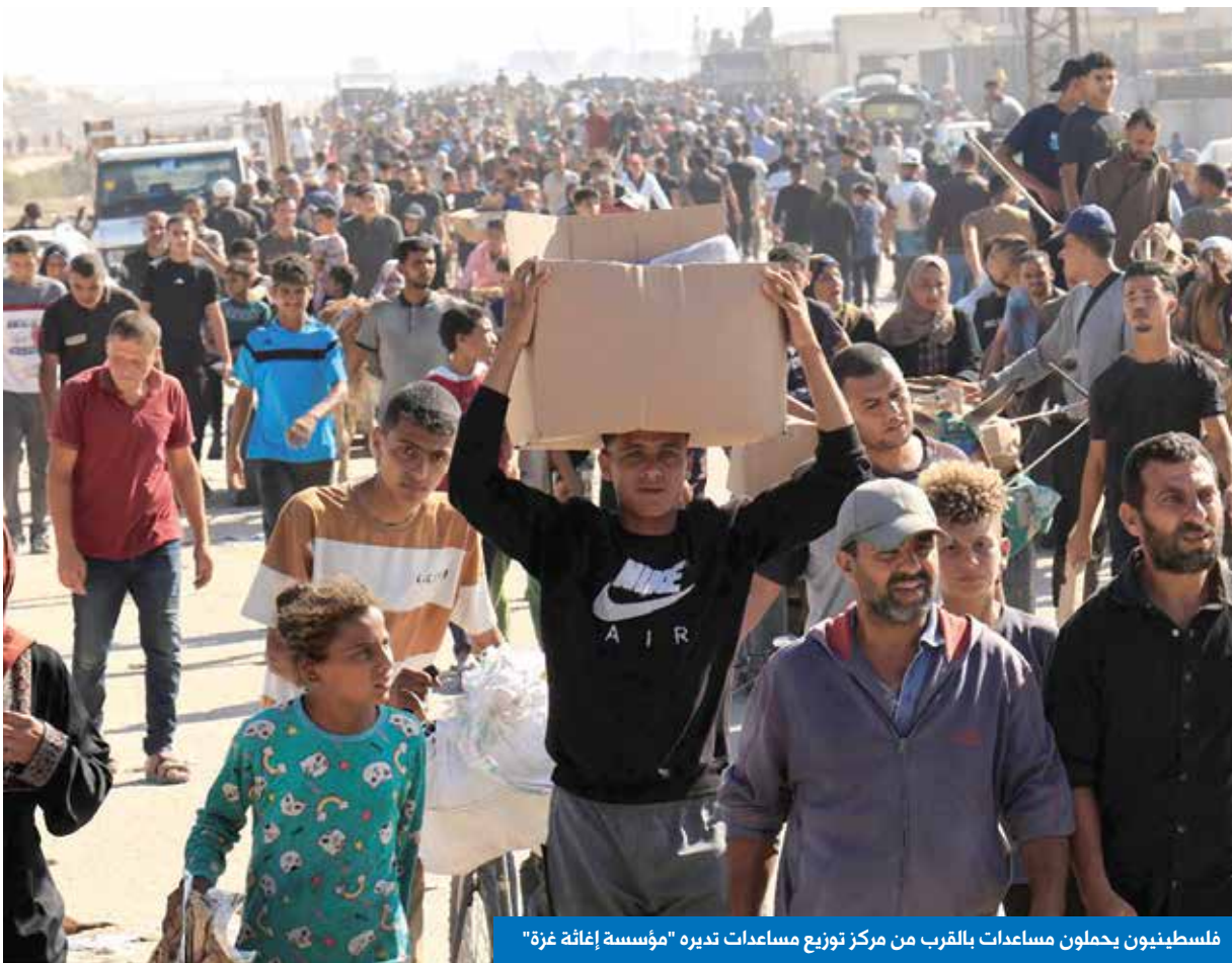
فلسطينيون يحلون مساعدات بالقرب من مركز توزيع مساعدات تديره "مؤسسة إغاثة غزة"