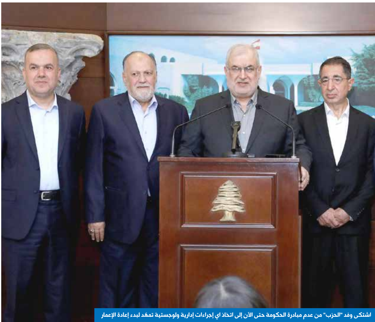
اشتكى وفد "الحزب" من عدم مبادرة الحكومة حتى الآن إلى اتخاذ أي إجراءات إدارية ولوجستية تصفد لبدء إعادة الإعمار