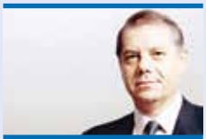
الوزير السابق جوزف الهاشم

هذا الذي عُرف برجل «الكابوي» الأميركي، يسعى وراء اصطيد الجوائز وبيارز بالمسدسات، حلّت عليه نعمة الروح القدس فارتدى الثوب البابوي قبل أن يُنتخب البابا الأميركي لاوون الرابع عشر، وهو الذي قال خلال حملته الإنتخابية، «إنّ الله أنقذه من محاولة الإغتيال ليكرّس نفسه لخدمة أميركا...» فإذا هو يستوحي العزة الإلهية ليكون رسول السلام العالمي لبني البشر.