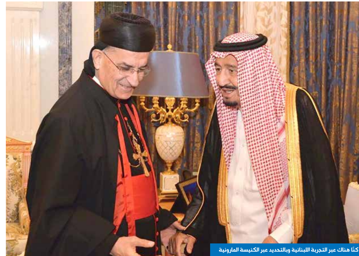
كنا هناك عبر التجربة اللبنانية وبالتحديد عبر الكنيسة المارونية

إلا أنّه اليوم وبسحر ساحر، وبعد 24 سنة، أصبح الإسلام عامل استقرار والعالم العربي مساحة للتبادل التجاري والاقتصادي ولبنان للأسف غائب عن هذا المشهد، وذلك ليس بسبب غياب رئيسي الجمهورية والحكومة عن المشهد، بل لأنّ التجربة اللبنانية هي تجربة مصالحة العالم العربي مع الخارج، وهي تجربة الشراكة مع الخارج، لأنّ التوتّع اللبناني وموقع لبنان الجغرافي جعلاً من هذا البلد الفريد همزة وصل بين ثقافتين وعالمين. لكن في هذه اللحظة المصيرية والتاريخية التي يجب أن يستفيد منها لبنان، يغيب وترفع العقوبات عن الشرع عوض أن يكون لبنان حاضراً وشاهداً ومستفيداً! إلا أنّ القرار على رغم من كل شيء، وفق المراقبين، سينعكس إيجاباً على لبنان. إذ إنّته وخلال مرحلة عقوبات «قانون قصير» وعزل سوريا، تحوّل إلى اقتصاد رديف لسوريا، ودفع لبنان ثمن ارتفاع الدولار والعقوبات على سوريا... وكنا من خلال التسهيلات عبر مطار بيروت نستقدم الأغنام والدواء ويشط التهريب إلى سوريا ليستفيد بعض التجار، أمّا اليوم فالرواية معكوسة، لأنّ سوريا دخلت في ورشة إعمار كبيرة، ولن يعود لبنان الخزان