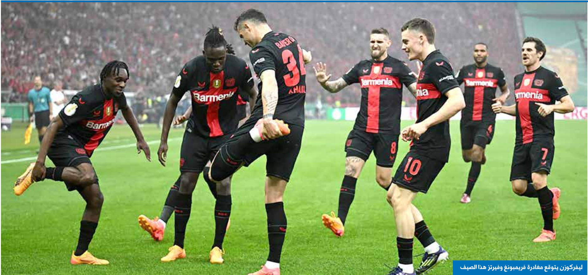
ليفركوزن يتوقع مغادرة فريمبونج وفيرترز هذا الصيف

الأندية والمنتخبات مجتمعة. لكن خلال العامين الماضيين، ومنذ تعافيه من إصابة الركبة التي حرمته من المشاركة في كأس العالم 2022، تطوّر إلى واحد من أكثر صانعي الألعاب تدميراً في أوروبا؛ لاعب مميز في حمل الكرة، قادر على التسلل بين الخصوم بسلاسة مزعجة، كما أنه يشغل مركز «رقم 10» بالمعنى التقليدي، بفضل تمريراته الحادة والاختراقية. لكن راقب تحركاته من دون الكرة، فهناك تكمن إحدى نقاط قوّته الحقيقية. يعمل فيرترز بجذّ كبير للعثور على المساحات واستغلالها بين خطوط الخصوم، ونتيجة لذلك، من الصعب جداً منعه من استلام الكرات، بالتالي التأثير على سير المباريات. ومع ذلك، لا يزال أمامه مجال للنمو. فهو يُسجّل أهدافاً رائعة، لكنّه ليس هدافاً ثابتاً بعد، ويُميل إلى إهدار الفرص أحياناً. وعندما يفرض عليه الخصوم رقابة لصيقة في وسط الملعب، كما فعل بايرن ميونيخ في الذهاب ثمن نهائي دوري الأبطال، يجد صعوبة في التخلص من تلك الرقابة.