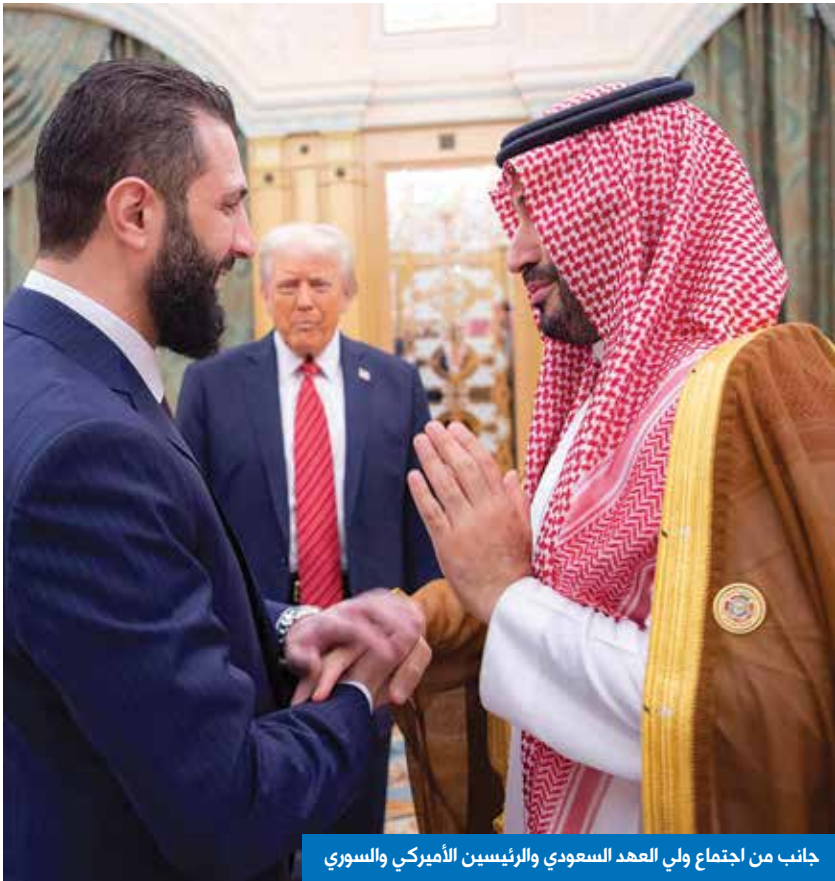
جانب من اجتماع ولي العهد السعودي والرئيسين الأمريكي والسوري