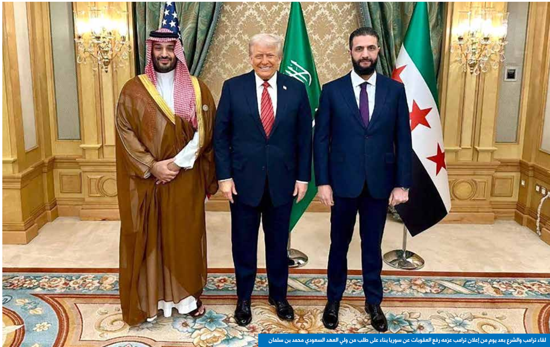
لقاء ترامب والشرع بعد يوم من إعلان ترامب عزمه رفع العقوبات عن سوريا بناء على طلب من ولي العهد السعودي محمد بن سلمان

«تصرفات عدائية» للجيش الإسرائيلي، بعد تعزّض أحد مواقعها لإطلاق نار من الجانب الإسرائيلي».