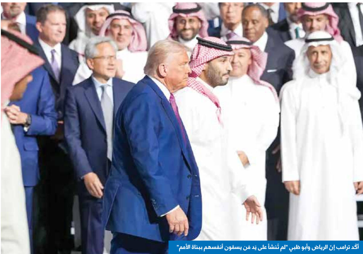
أكد ترامب إن الرياض وأبو ظبي «لم تنشأ على يد من يسفون أنفسهم ببذلة الأمم»

الأقلية، أنه يعترض تعطيل تعيينات ترامب في وزارة العدل حتى يحصل على مزيد من المعلومات بشأن خطط الرئيس لقبول الطائفة.