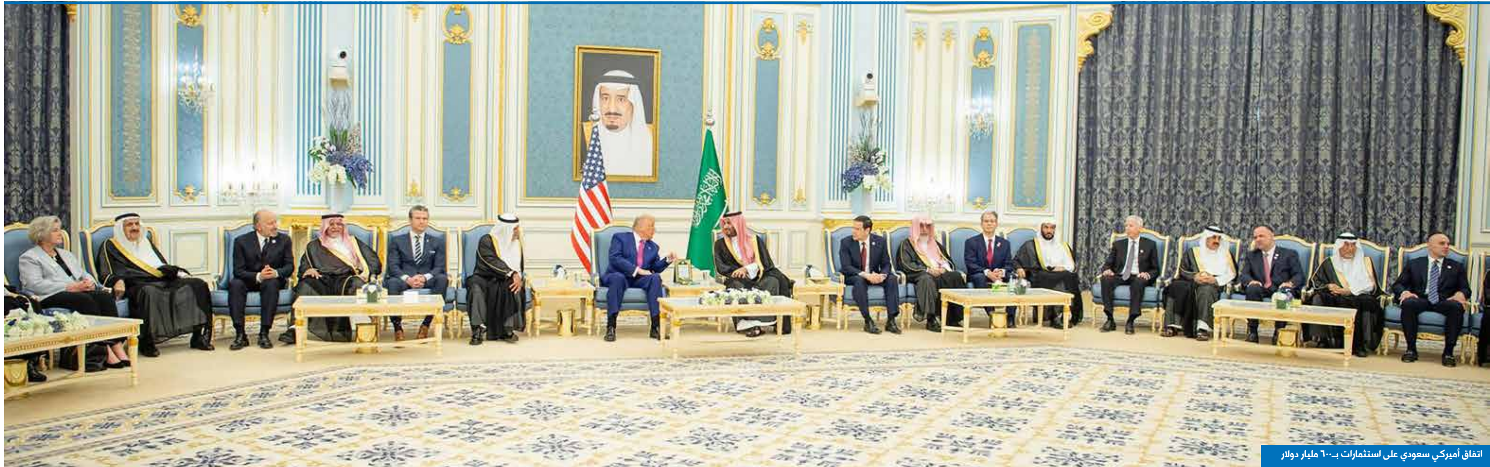
اتفاق أميركي سعودي على استثمارات بـ٦٠ مليار دولار