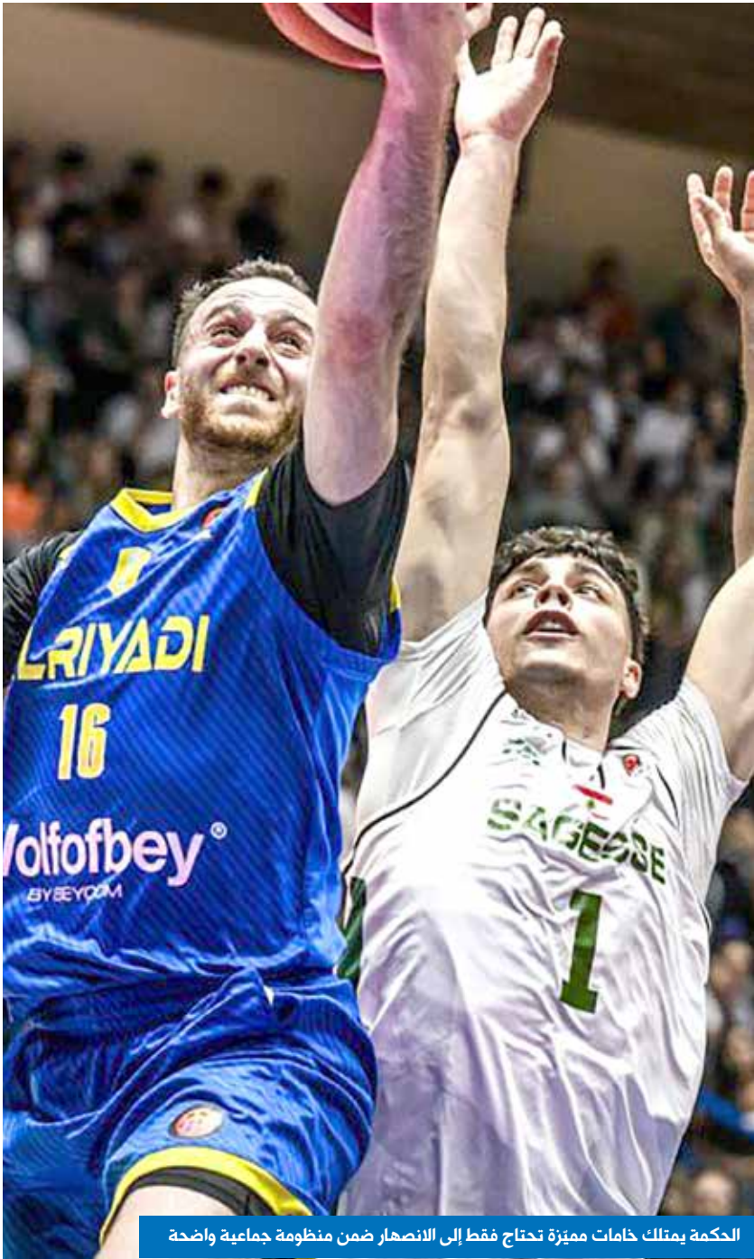
الحكمة يمتلك خامات مميزة تحتاج فقط إلى الانصهار ضمن منظومة جماعية واضحة

بين الماضي المجيد والحاضر المتجدّد، يبقى هذا اللقاء دليلاً حياً على أنّ دربي بيروت لا يموت، بل يعود كل مزة ليُشعل الساحة من جديد