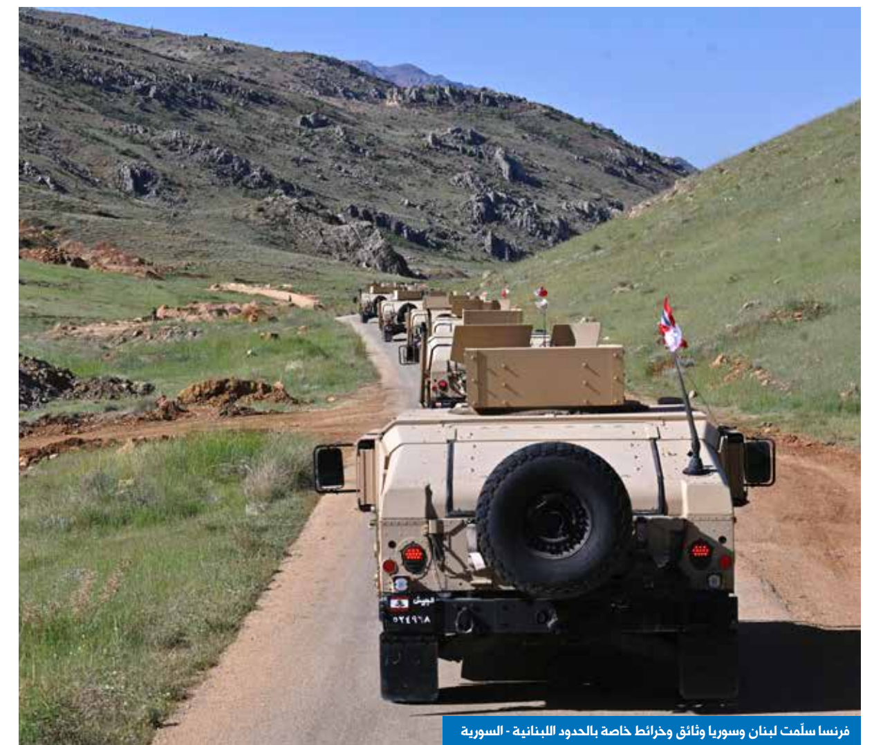
فرنسا سلّمت لبنان وسوريا وثائق وخرائط خاصة بالحدود اللبنانية - السورية

وانطلاقاً من هذه النظرة التاريخية في علاقة باريس ودمشق، ومعرفة الأولى بدقائق الديموغرافيا السورية، والعوامل الجيوسياسية التي تحملها على صوغ مقاربة جديدة في التعامل مع الواقع المستجد بعد سقوط نظام بشار الأسد، فإنّ الرئيس إيمانويل ماركون حرص على فتح الباب أمام الرئيس الانتقالي لسوريا أحمد الشرع ومحاورته في شأن مستقبل العلاقة بين البلدين، خصوصاً أنّ الأخير - وعلى رغم من الحذر الذي أشاعه وجوده على رأس السلطة في عاصمة الأمويين- يحظى بدعم أميركي مباشر، مصحوباً بحرص على تغيير «اللون» الذي أثر عليه، وإبرازه وجهاً مدنياً متقدماً ليس فيه أي أثر من صورة «الجلواني»، ولكن لفرنسا في سوريا تاريخاً من التواصل مع الأقليات فيها، عندما كانت تتشكّل ملامح الدولة فيها، وكانت يومها مقسّمة إلى مناطق عدة، وهناك