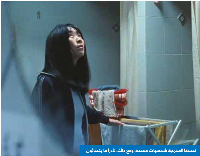
تمنحنا المخرجة شخصيات معقّدة، ومع ذلك، نادراً ما ينحتنون

غالباً ما يُقال إنّ نيويورك مدينة أحياء، مجرّات صغيرة مستقلة بذاتها، لكنّ الحقيقة أكثر دقّة