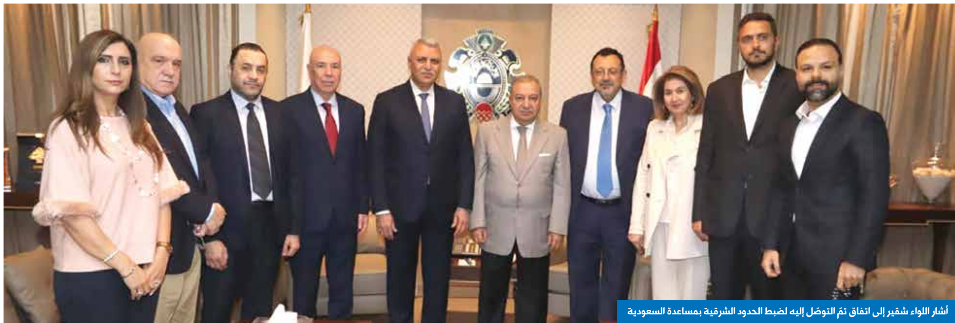
أشار اللواء شقير إلى اتفاق تمّ التوصل إليه لضبط الحدود الشرقية بمساعدة السعودية

4- دولة سنّية في سوريا. والبعض يتحدث عن دولتين، إحداهما تقع تحت تأثير تركيا. 5- دولة علوية في الساحل السوري. وثمة من يعتقد أنّ الفكرة تحظى بدعم روسيا ضمناً، لتبقى لها نقطة تموضع استراتيجي على المتوسط. 6- دولة درزية في محافظة السويداء. وملامحها تتبلور بدعم إسرائيلي مباشر. مسار هذه السيناريوهات يبقى حتى اليوم غامضاً. لكن بعض المحللين يعتقد أنّ التحولات التي ستقبل عليها المنطقة ستبلورها الحروب الإسرائيلية في دول الشرق الأوسط. من غرة والضفة الغربية إلى لبنان وسوريا واليمن، وربما ساحات أخرى متعددة، إضافة إلى الملف الإيراني الذي ما زال قيد الإنضاج. وفي أي حال، يبدو حتمياً أنّ الشرق الأوسط لن يبقى كما كان. واحتمالات التقسيم فيه لم تعد ضعيفة. وعندما يبدأ التفسخ في سوريا والعراق، فمن الحتمي التفكير في الانعكاسات المؤكّدة على لبنان وكل الكيانات التي رسمها الشائني سايبكس وبيكو ذات يوم، قبل أكثر من 100 عام.