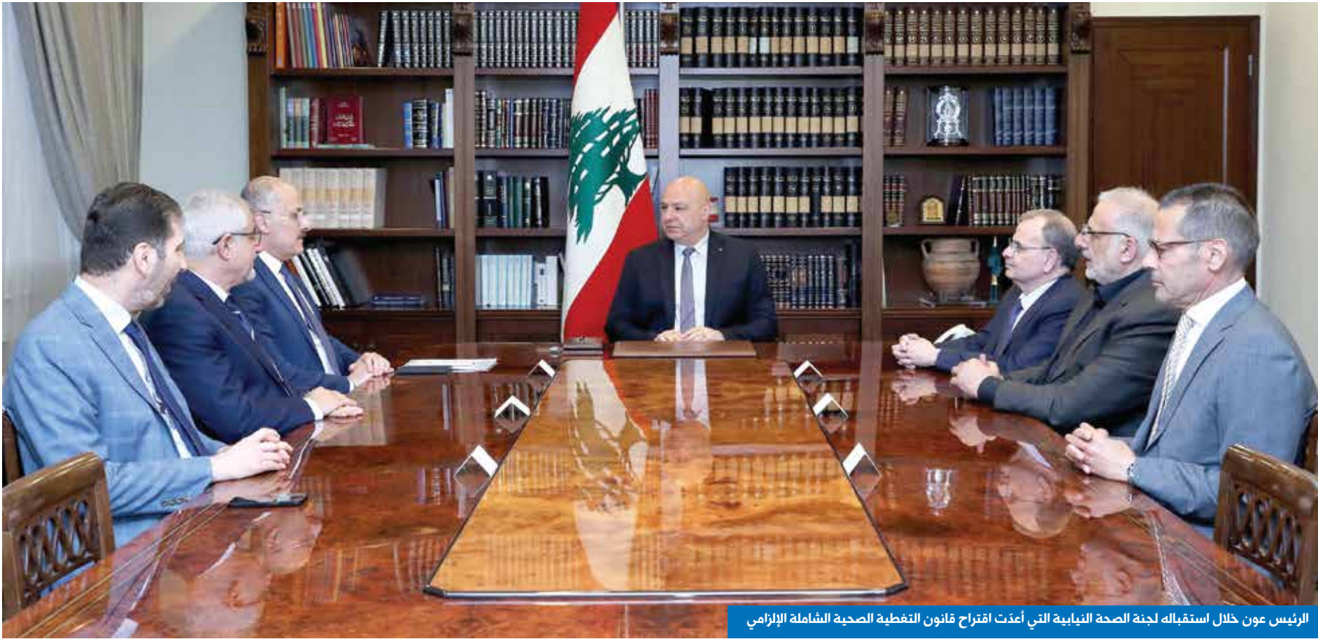
الرئيس عون خلال استقبله لجنة الصحة النيابية التي أعادت اقتراح قانون النطفية الصحية الشاملة الإلزامي

وفي درشة له مع «الجمهورية»، قال سفير دولة اوروبية كبرى «أن دول الاتحاد الاوروبي إلى جانب الرئيس جوزاف عون في سعيه إلى حصر السلاح بيد الدولة اللبنانية وحدها، وتشاركة تاكيدَه أن هذا الأمر، إلى جانب مجموعة الخطوات الاصلاحية يشكّل الحاجة الملحة لقيام دولة قادرة على الإنقاذ والإصلاح».