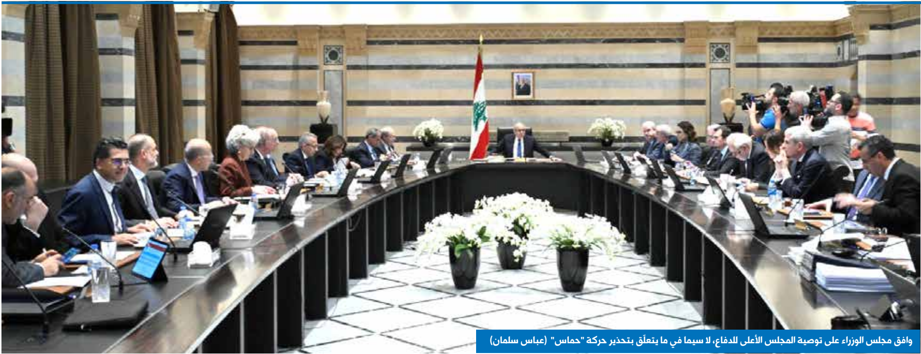
وافق مجلس الوزراء على توصية المجلس الأعلى للدفاع، لا سيما في ما يتعلق بتحذير حركة "حماس"

النيابية، وجرس هذه الانتخابات يُقرّع من بدايتها، فالمجلس النيابي الحالي تنتهي ولايته في 31 أيار من العام المقبل، أي بعد 13 شهراً، والقانون الانتخابي يوجب إجراء الانتخابات خلال الـ60 يوماً السابقة لموعدها انتهاء ولاية المجلس، أي بين أول نيسان وأخر أيار من العام المقبل. ولنفتقر إلى موعد الانتخابات قد تحدّد منتصف شهر أيار على ما جرى في انتخابات العام 2022، فإن القانون نفسه يلحظ إقفال باب الترشيحات قبل 60 يوماً من موعد الانتخابات أي في 15 آذار وتحديداً بعد 11 شهراً، كما يلحظ انتظام المرشحين في لوائح وتسجيل هذه اللوائح قبل 40 يوماً من موعد الانتخابات، ما يعني أنّ هذا الأمر سينجز في شهر نيسان. وعلى ما يجري فإن ما يحصل في كل انتخابات تُعدّ مستلزمات العملية الانتخابية وما فيها من تحضيرات وجولات انتخابية وحراك ماكينات وعقد تحالفات واستنفار لكل ما له علاقة أو صلة بهذا الاستحقاق، تستغرق على الأقل فترة السنة أشهر السابقة لموعدها الانتخابات، أي ابتداءً من كانون الأول المقبل، أي بعد 8 أشهر. يُضاف إلى ذلك الكباش السياسي والنيابي الذي لم يَعد بعيداً حول القانون الانتخابي الحالي، مع سلسلة الاقتراحات النيابية المطروحة لإدخال تعديلات عليه، ما يعني أنّ هذا الأمر وسط التفرّغ النيابي والحكومي لهذا الأمر، سيأكل شهراً وربما أكثر في هذه المعجمة، ولا يُغفل في هذا السياق أيضاً استحقاق الموازنة العامة التي وعدت الحكومة بإنجازها في موعدها.