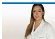
ساندي بو يزك

صحيحاً، فيعض المنتجات الخالية من الغلوتين أقل توازناً غذائياً لتحسين المذاق والقوام. غالباً ما تلج الشركات إلى إضافة كميات أكبر من السكر، الدهون المشبعة، أو النشويات البسيطة، كخبز الأرز الأبيض أو الطحين المعدل الذي يحتوي على مؤشر غلايسيمي عالٍ، ويؤثر بسرعة على سكر الدم. وتبين أن العديد من المنتجات الخالية من الغلوتين تحتوي على، سرعات حرارية أعلى بنسبة 20-30%، سكريات مضافة أكثر بـ 40%، والياف أقل بنسبة تصل إلى 60% مقارنة بالمنتجات العادية. وهذا قد يؤدي إلى زيادة الشهية، ضعف في السيطرة على السكر، بل وحتى زيادة في الوزن عند الاستهلاك المتكرر.