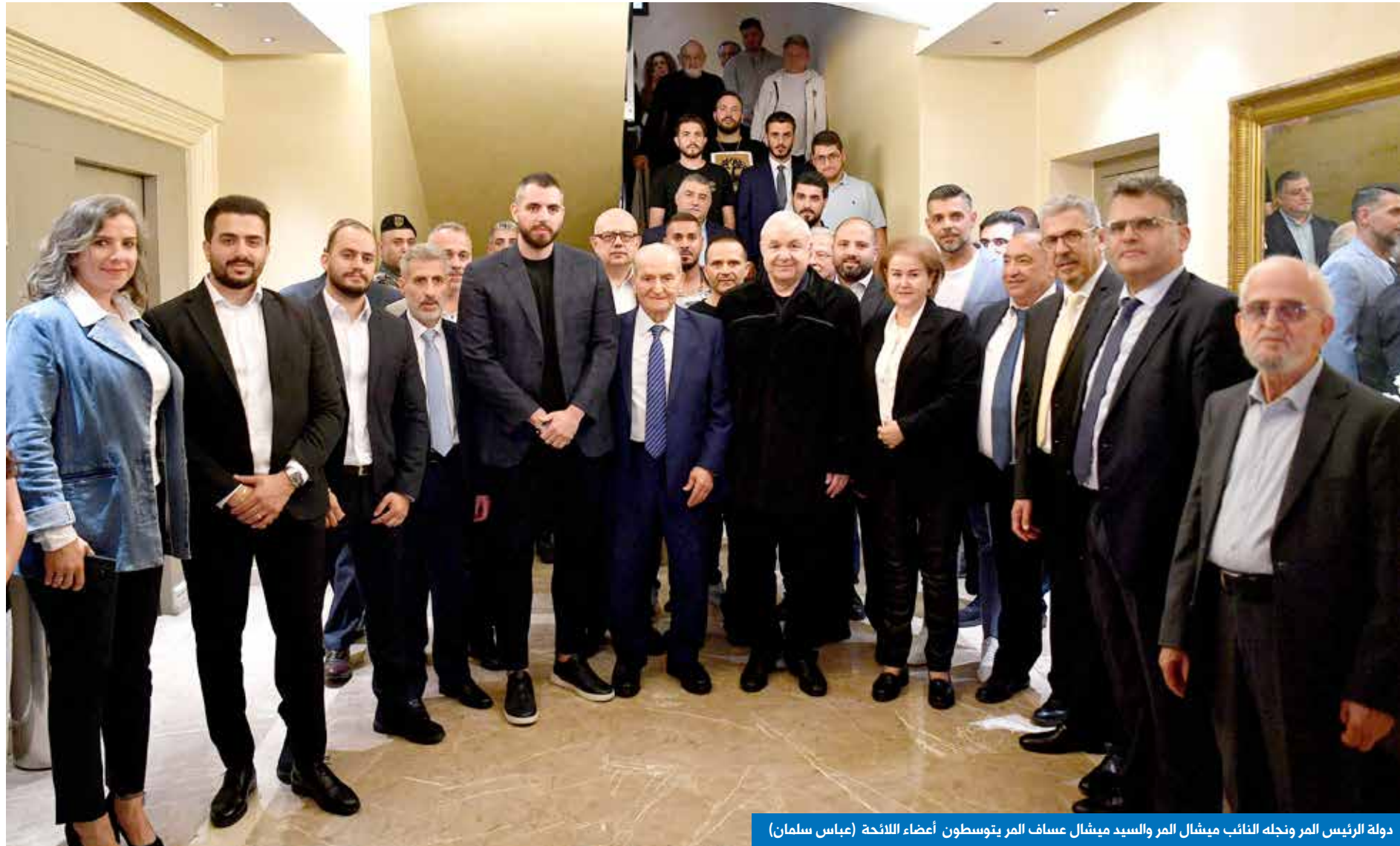
دولة الرئيس المر ونجله النائب ميشال المر والسيد ميشال عساف المر بتوسطون أعضاء اللائحة (عباس سلمان)

هنا لأنني اعتبر الزلqa والعمارة ضيعتي، وأهلها أصدقائي وأهلي. جئت لأؤكد أنّ الوفاء في هذه الحياة هو قيمة إنسانية عظيمة ، نشأنا عليها وتمسكنا بها، ولا قيمة لحياة بلا وفاء». وقال الرئيس الياس المر: «كنا وسنبقى إلى جانبكم، خاصة أنكم كرئيس للبلدية وأعضاء في المجلس البلدي وكمختارين، أعطيتم عمركم لخدمة بلدتكم ومدينتكم وأهلكم بتقان وإخلاص. وفقكم الله وسدد خطاكم لما فيه خير بلدتكم وعائلاتكم العريقة».