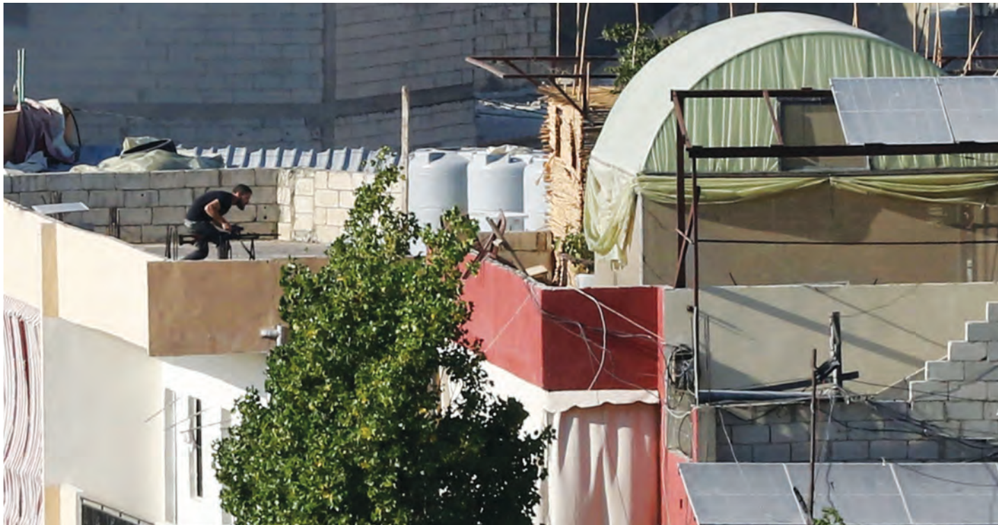
ينتظر حوالي ٦ آلاف طالب فلسطيني داخل المخيم إخلاء مدارس "الأونروا" من المسلحين

دخل قرار اتفاق وقف إطلاق النار الجديد في مخيم عين الحلوة، والذي تمّ التوصل اليه في الاجتماعين اللذين عقدهما رئيس مجلس النواب نبيه بري مع كل من عضو اللجنتين التنفيذية لمنظمة التحرير الفلسطينية والمركزية لحركة "فتح" المشرف على الساحة اللبنانية عزام الاحمد، وعضو المكتب السياسي لحركة "حماس" موسى أبو مرزوق، حيز التنفيذ عند السادسة من مساء أمس الأول. وبعدها شهد المخيم خروقات ليلية متقطعة لوقف إطلاق النار، بدأت الحركة تعود إلى طبيعتها في صيدا، بعد الشلّ الذي أصاب المدينة بفعل الاشتباكات التي استمرت أسبوعاً كاملاً.