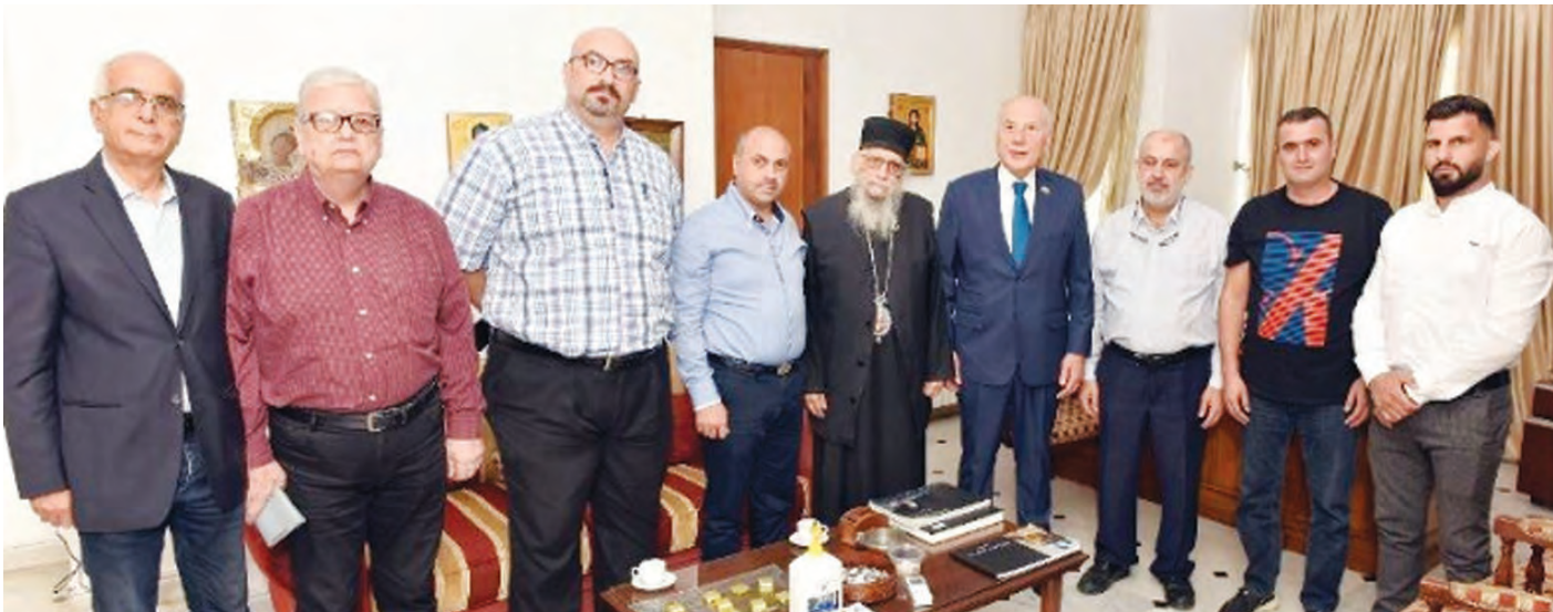
خلال اللقاء مع المطران كريكوس

اعتبر راعي أبرشية طرابلس والكورة وتوابعهما للروم الأرثوذكس المطران أفرام كريكوس، أنّ "تشغيل مطار القليعات يتكامل مع مطار بيروت الدولي، ويحيي ليس الشمال فقط ولكن أيضاً بلدان الجوار والعالم".