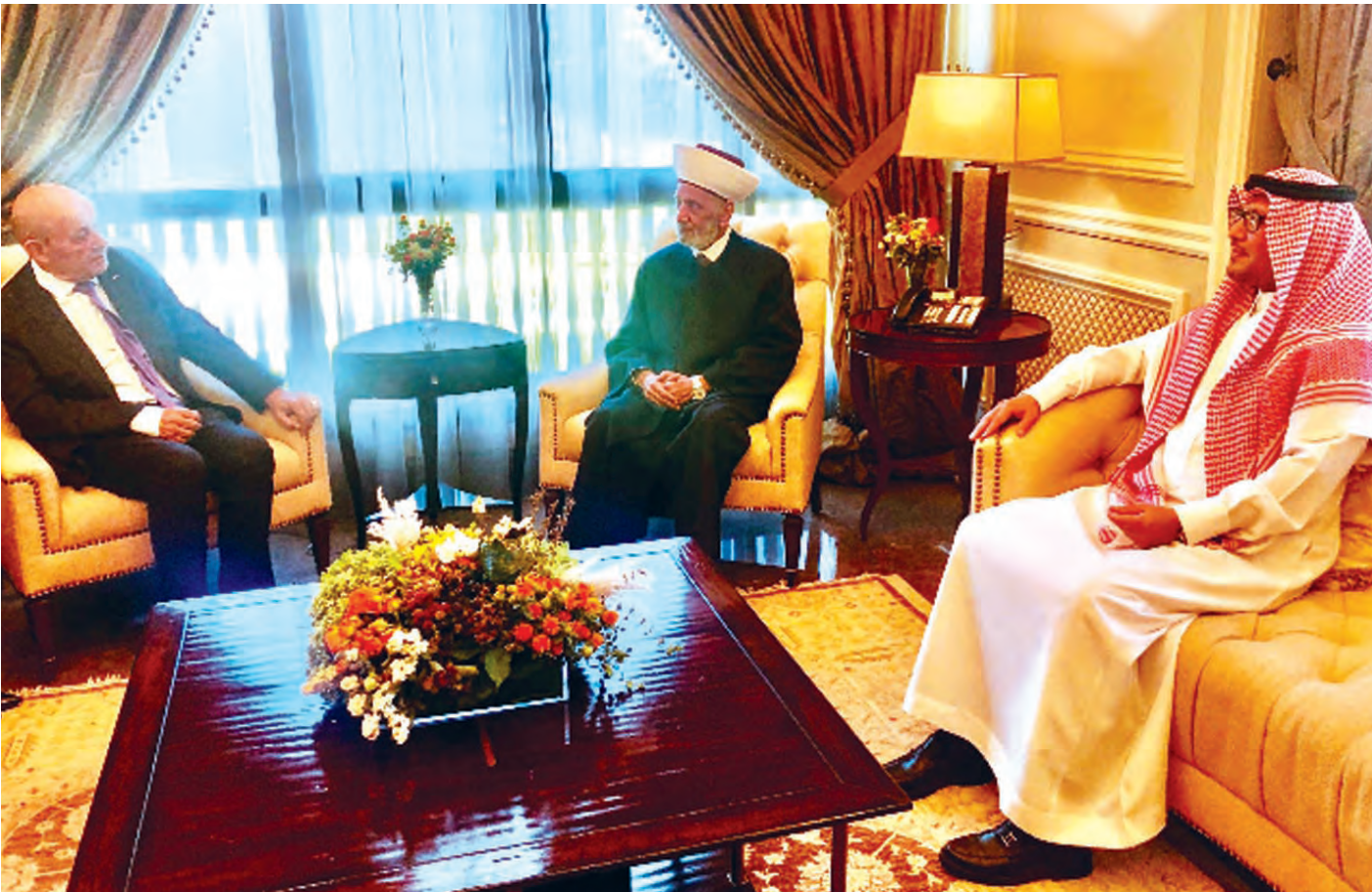
ما حصل كان متوقفاً ما عدا لقاء دريان ولودريان والبخاري

فليس سراً ان المعارضين للدعوة كانوا أكثر صراحة من الذين وافقوا او وضعوا مجموعة من الشروط التي يمكن ان تقلل من اهمية هذه المشاركة. فقد سبق لهؤلاء ان سجّلوا ملاحظات عدة حول مجموعة أفكار تمّ التداول بشأنها، وهي تتصل بشكل ومضمون الحوار الموسع ومن يتولى رئاسة جلساته وإدارتها. إن بقي صاحب الدعوة على موقفه المتزدد على رئاسة أي طاولة طالما أنه تحوّل «طرفاً» بترشيحه الوزير السابق سليمان فرنجية، ولم يعد حيادياً. وما زاد من نسبة القلق، أنّ الرهان على ما يمكن ان يقوم به لودريان لجهة قيادة مثل هذا الحوار قد سقط، وجاءت جولته الثالثة لتعطي نموذجاً لما يمكن ان يقوم به بالقدرات المتوفرة داخلياً وخارجياً. وما زاد في الطين بلة، إنّ صحت المعلومات التي قالت بأنّه كان ينوي دعوة رؤساء الكتل النيابية الى عشاء في نهاية زيارته، ولم تتل الفكرة موافقة أكثرية المعنيين وقد صرف النظر عنها. وتأسيساً على ما تقدّم، فقد أدّى افتقاد لودريان لأي خطوة عملية يمكن القيام بها، إلى تراجع الآمال التي غدّت على الزيارة.