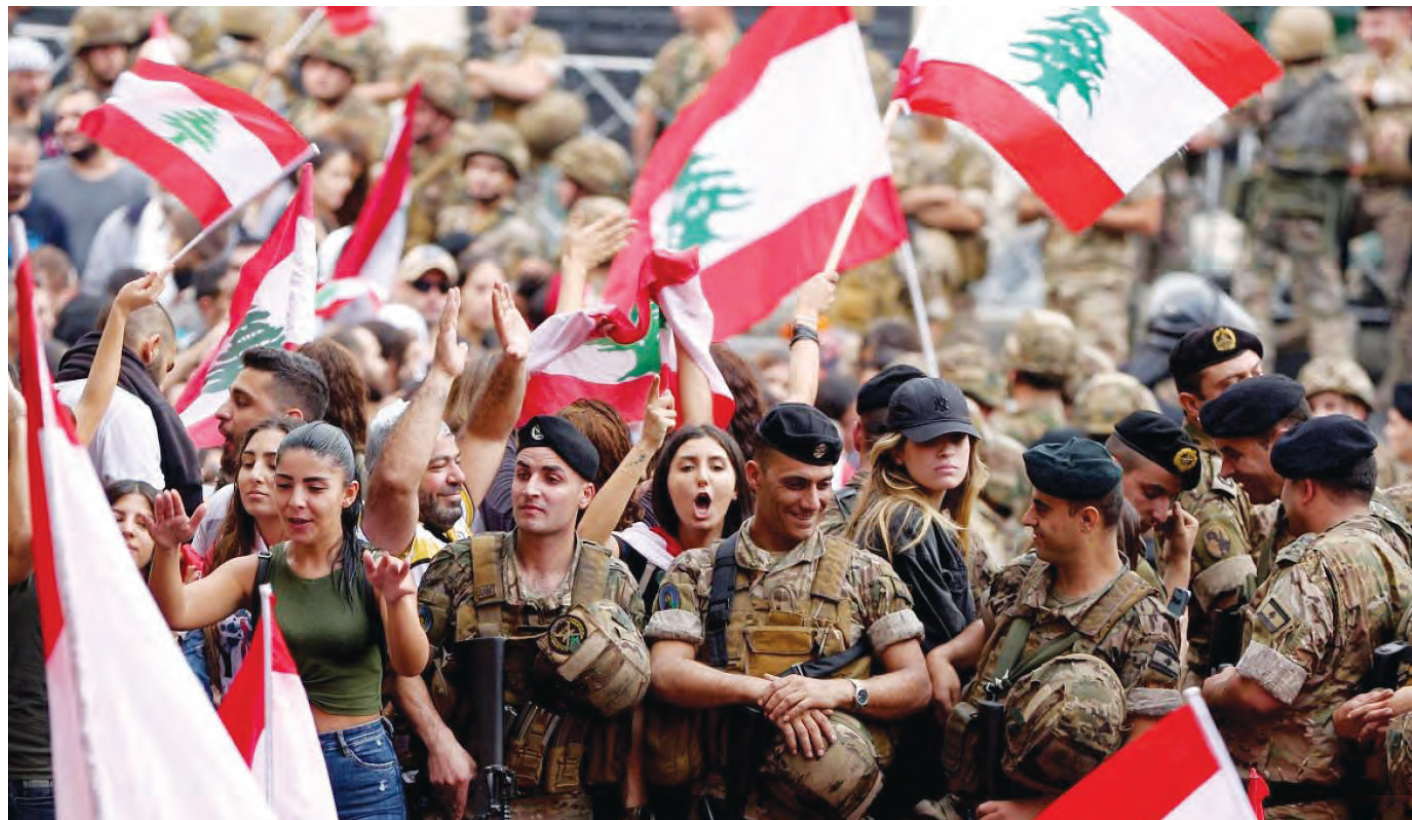
الجيش لا ترتاح في الدخول الى اراضي فيها مقاومة

شيعية قادرة على الدفاع عن الأرض، هذه لا يجوز تفكيكها بل العكس تعميمها على الفئات اللبنانية الأخرى، خاصة أنه حالياً هناك على الأراضي اللبنانية مجموعات غير لبنانية مسلحة لا تعرف حجمها، تهدد كياننا. لتحقيق أكبر نسبة من القدرة الدفاعية، على جميع اللبنانيين أن يمتلكوا قدرة حرب العصابات، مثل تجربة سويسرا بما يُعرف بـSwitzerland's militia system، فلا نكتفي بـحزب الله، بل نتعاون معه لاجتياح GUERILLAS مسيحية، سنية ودرزية وغيرها. وبالطبع نفترض ذلك على أساس أننا نريد الحفاظ على لبنان وتعميق الوحدة بين كل الاطراف، والعمل جميعاً للعيش في بلد واحد نسوده الأخوة والأمانة، أما إذا كنا لا نريد لبنان فهذا بحث آخر، وإذا كانت نتيجة خلق GUERILLAS من مختلف الطوائف هو ان نقاتل بعضنا البعض، فرما لا نستحق ان نكون بلداً واحداً، ولننتجَ إلى التقسيم ولا داعي للنقالات. هذا مع التذكير أنه كلما توحدت الشعوب قويت، وكلما انقسمت ضعفت.