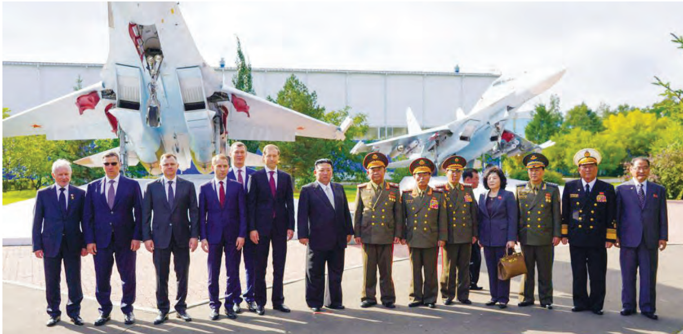
كيم جونج أون (في الوسط) أثناء زيارته لمصنع طيران في كومسومولسك أون أمور في روسيا

أعلن الكرملين أنه لم يتم توقيع أي اتفاقات خلال الزيارة التي يقوم بها الزعيم الكوري الشمالي كيم جونج أون إلى روسيا، في ظل مخاوف غربية من احتمال تحضير الدولتين المعزولتين اتفاق أسلحة.