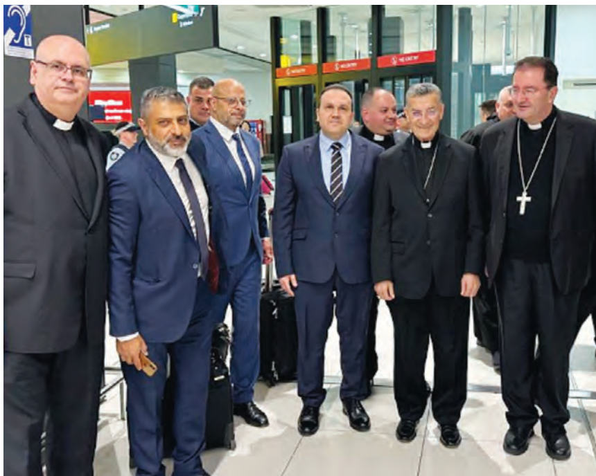
لدى وصول الراعي الى أستراليا

وصل إلى أستراليا أمس بطريك أنطاكية وسائر المشرق الكاردينال مار بشارة بطرس الراعي، في زيارة تشمل سيدني وملبورن وتستمر حتى الرابع والعشرين من ايلول الجاري.