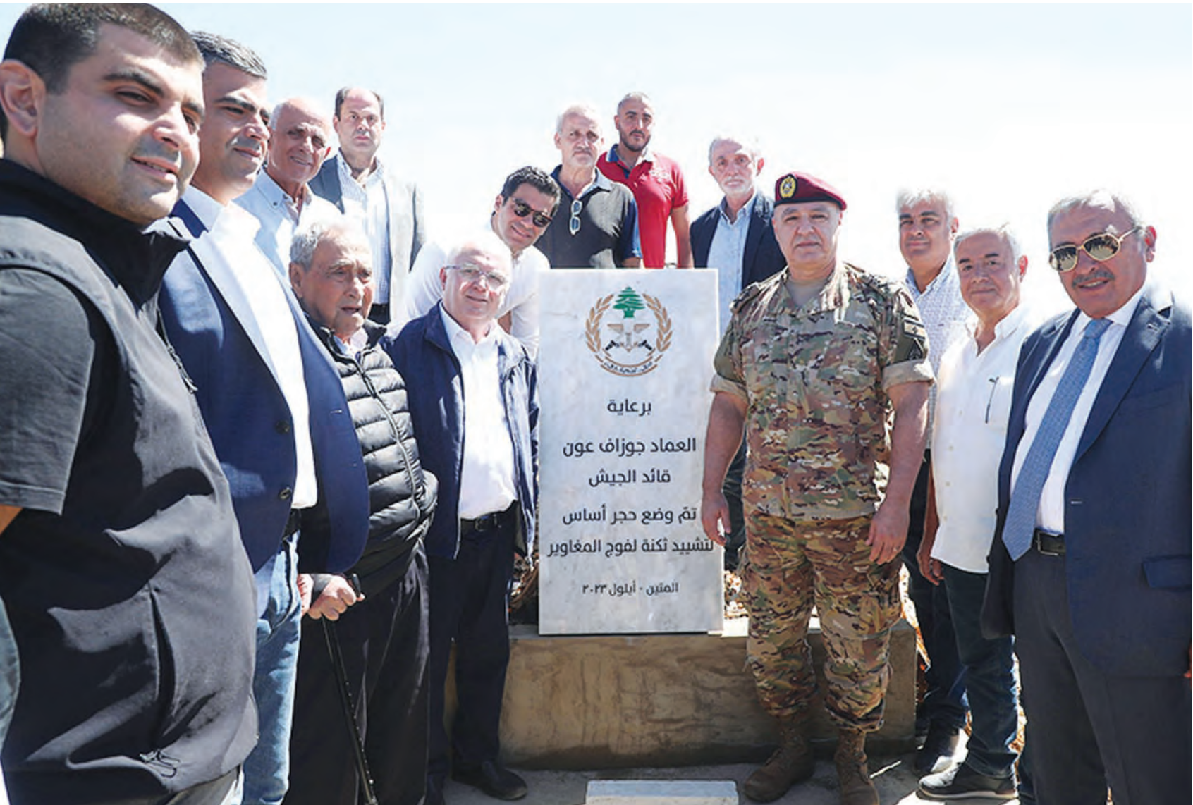
قائد الجيش يضع حجر الأساس لتدأي ضباط منطقة البقاع أمس

من «حزب الله»، بـ«قرارنا محسوم ونهائي، إنّنا مع فرنجية، ولن نتنازل عن دعمه، لأنه يعني الكثير بالنسبة اليه»، بل على رافضي ترشيح فرنجية مثل «التيار الوطني الحر»، الذي يضع فرنجية وقائد الجيش في خانة واحدة، فيما موقف حزب «القوات اللبنانية» الرافض جملة وتفصيلاً لانتخاب فرنجية، ملتبس حيال قائد الجيش، إلا أن هذا الالتباس يتبدّد مع إعلان «القوات» رفضها أي حوار يشكّل مضيقاً للوقت، ما خلا الحوار الذي ينبغي ان يحصل في جلسة انتخاب