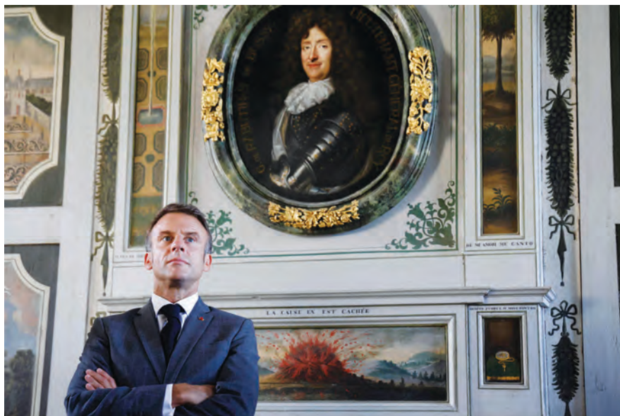
ماكرون خلال زيارة الى قلعة بوسي-رابوتان في بورغوندي

دافع الرئيس الفرنسي إيمانويل ماكرون أمس عن قراره حضور القداس الذي سيحتفل به البابا فرنسيس السبت في 23 أيلول في مرسيليا بجنوب شرق فرنسا، قائلاً إنّه سيذهب كـ«رئيس» لدولة علمانية ولكن ليس كـ«كاثوليكي».