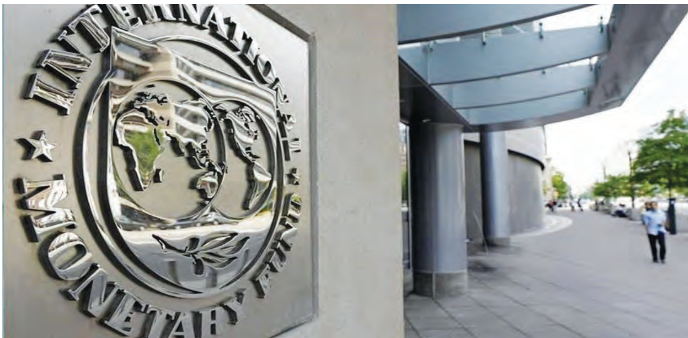
صندوق النقد متشائم حيال الوضع في لبنان

اعتبر وفد صندوق النقد الدولي الذي زار لبنان، أن عدم اتخاذ إجراءات للإصلاحات الضرورية بسرعة، يُثقل بشكل كبير على الاقتصاد. مشيراً إلى أنه بعد مرور 4 سنوات من بداية الأزمة، لا يزال لبنان يواجه تحديات اقتصادية هائلة، مع انهيار قطاع البنوك، وتدهور الخدمات العامة، وتراجع البنية التحتية، وتفاقم ظروف الفقر والبطالة، وتوسيع الفجوة في التفاوت الاقتصادي.