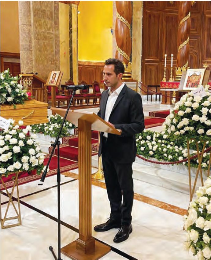
نجل الفقيد يلقي كلمة العائلة