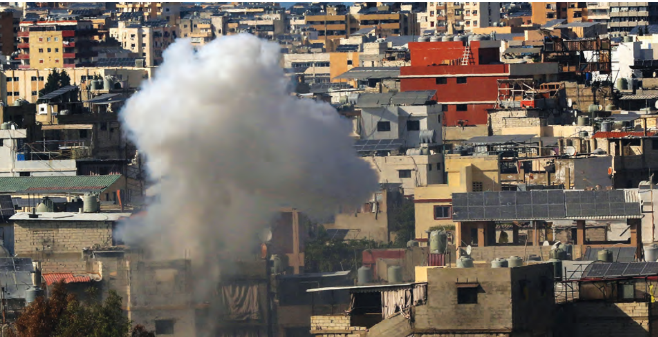
موقف "فتح" واضح مع الجسم العسكري، لو كان مكافأ وغير مضمون

في التنفيذ، بانتظار تصحيح الخطأ التاريخي القائم، والذي لا يستقيم إلا بتفكيك كافة المخيمات على الأراضي اللبنانية، وحل عادل للقضية الفلسطينية وفق قرارات الشرعية المسلحة من المدارس لا القضاء عليهم.