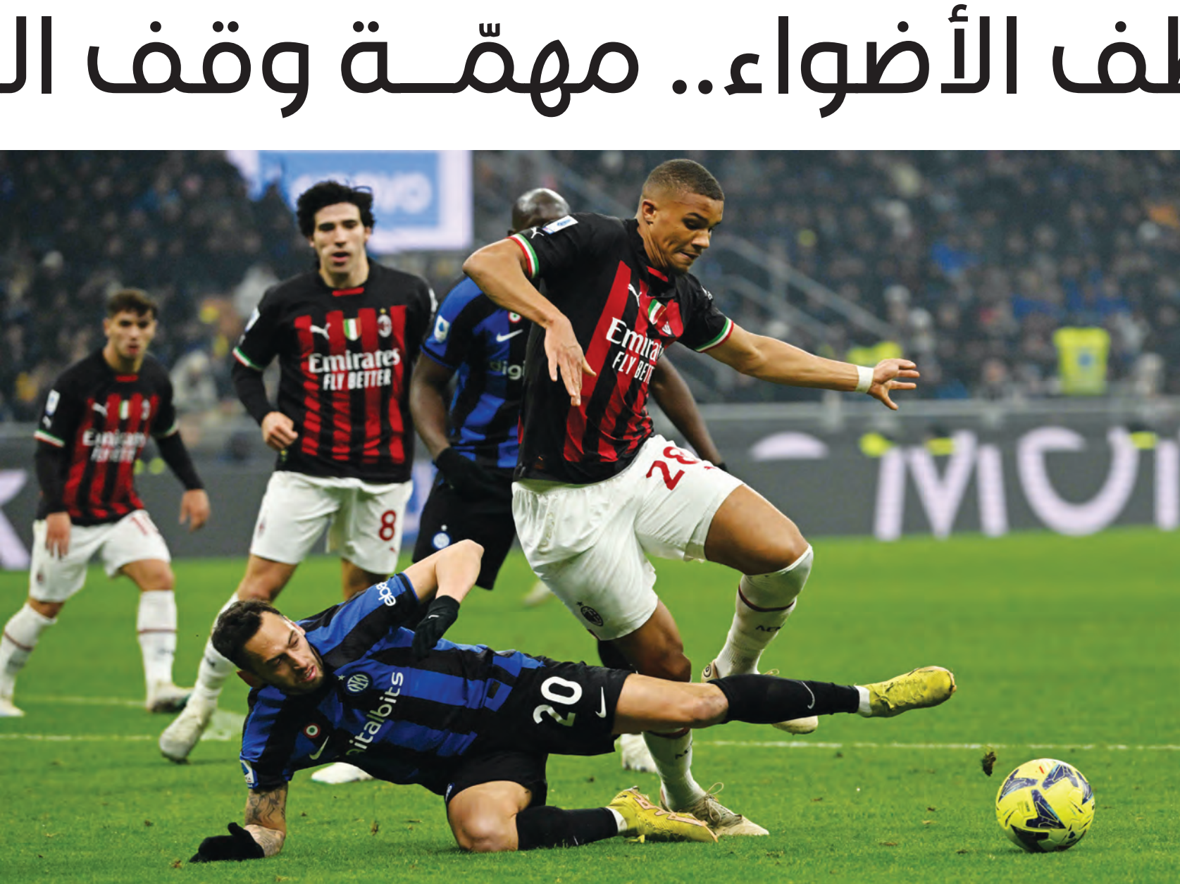
من دربي ميلانو بين إنتر وميلان الموسم الماضي

الجمهورية | 3657 | السبت 16 أيلول 2023 | www.aljournhouria.com | @aljournhouria