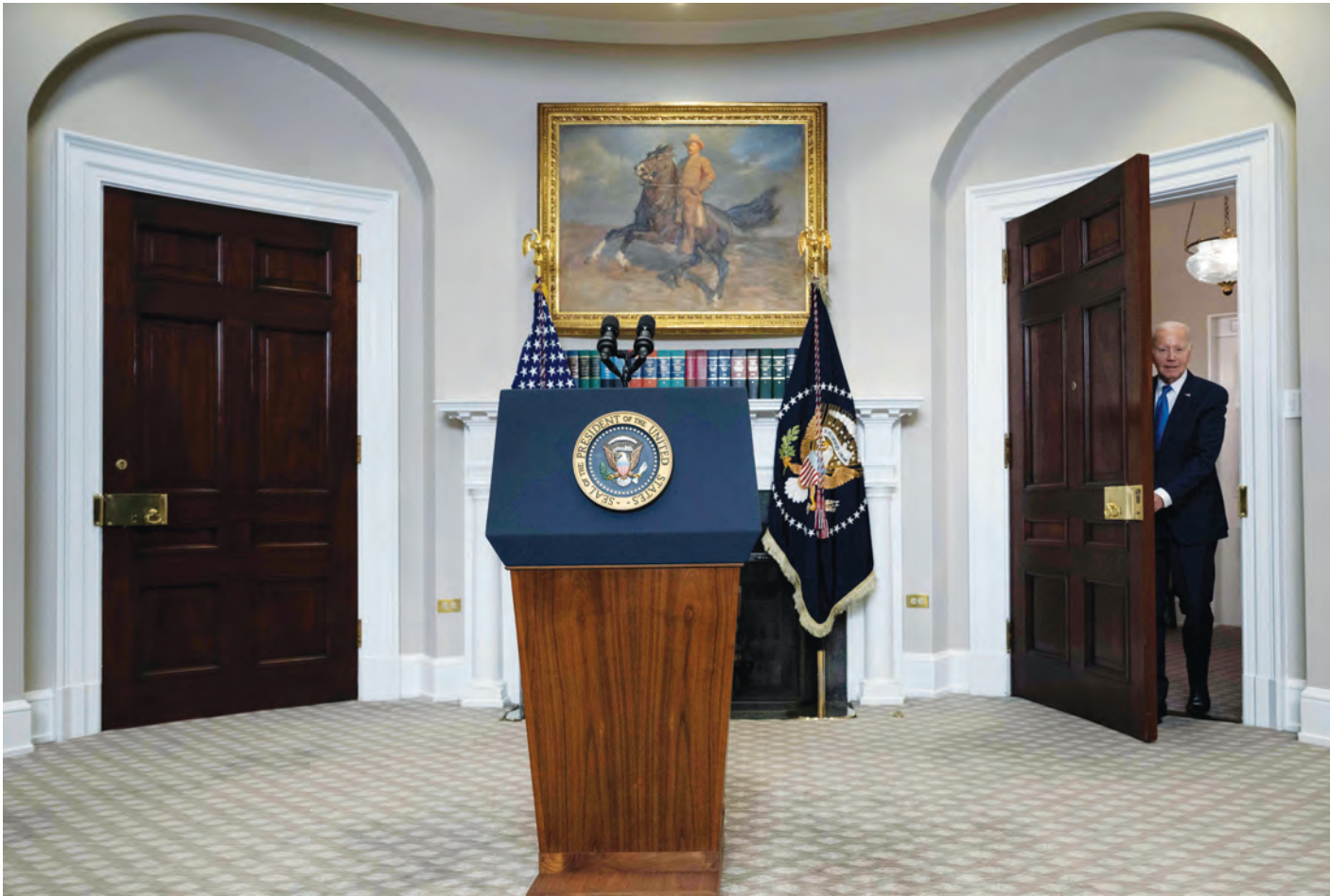
بايدن يصل الى قاعة روزفلت في البيت الأبيض للاعلان بتصريح أمام وسائل الاعلام

أكد الرئيس الأمريكي جو بايدن أمس، أنَّ الولايات المتحدة تدعم الإيرانيين، بعد عام على الاحتجاجات التي أشعلتها وفاة مهسا أميني، معلناً عن عقوبات جديدة بحق منتهكي حقوق الإنسان "بشكل صارخ". وأعلنت لندن هي الأخرى، عن عقوبات على طهران بالمناسبة نفسها.