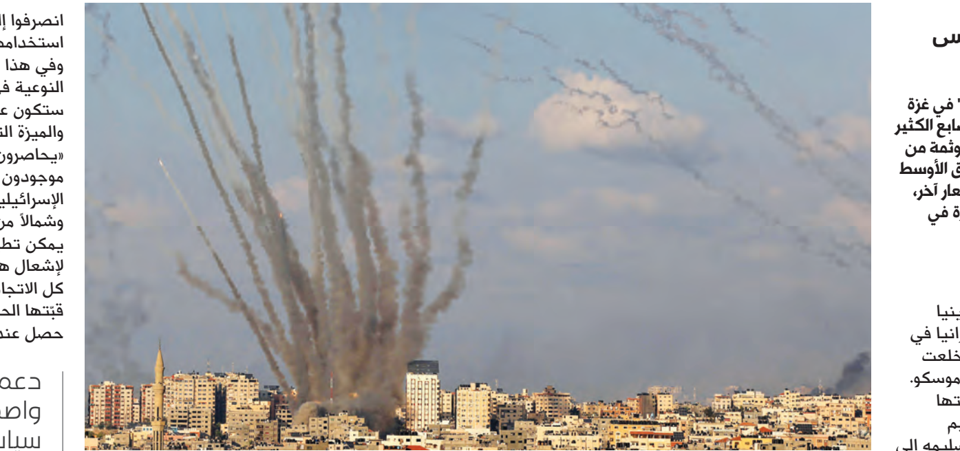
أطلقت "حماس" هجومها برعاية مباشرة من إيران

فقد تمكّن الإسرائيليون من ضرب المفاعل النووي العراقي، «تموز»، في العام 1981، لأنّه يقع في المدى الجغرافي المناسب لمقاتلاتهم، لكن بُعد المسافة وأبرمت لهذه الغاية تفاهات متعددة الجوانب مع كل من موسكو وطهران.