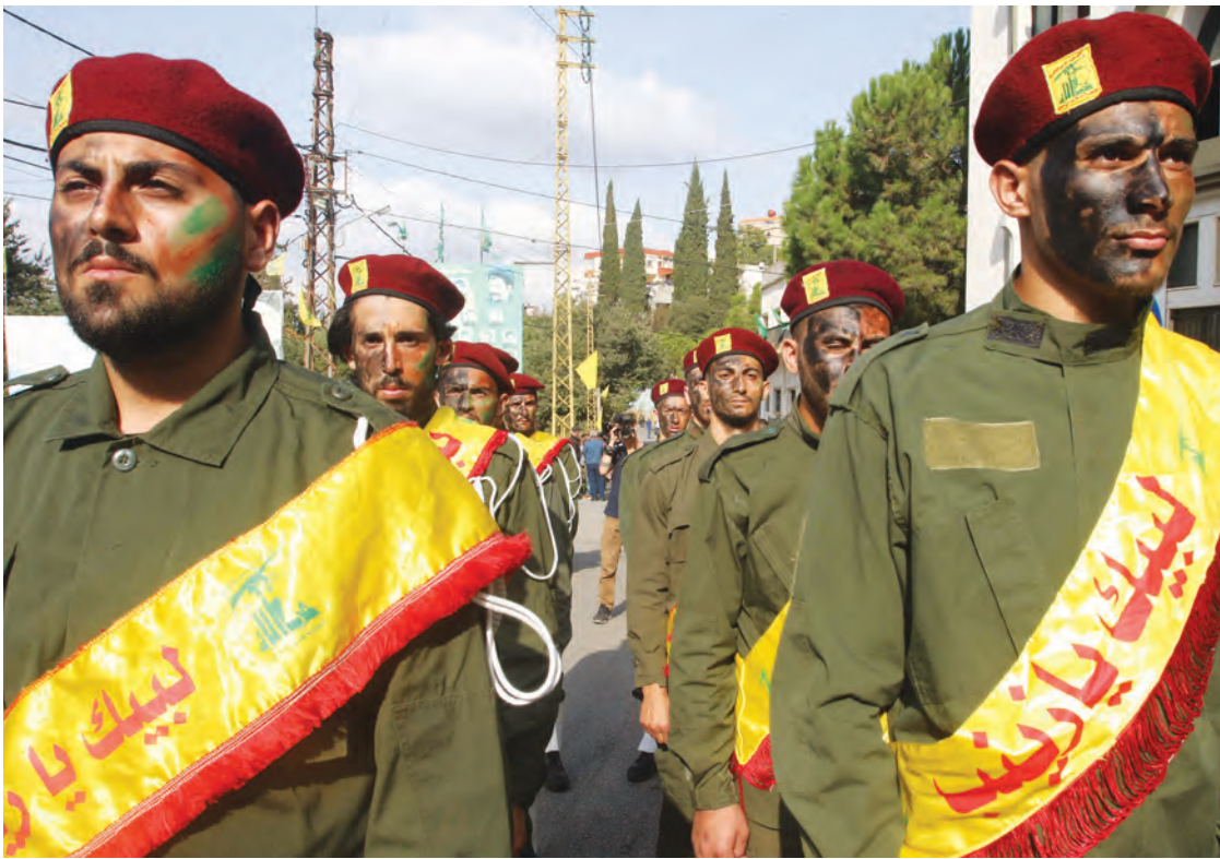
حزب الله يشنّ عناصره الذين سقطوا في القصف الإسرائيلي الذي طال أحد مواقعه الإثنين

أعلن "حزب الله" أمس استهداف ملّالة إسرائيلية بصاروخين موجّهين، بينما أعلنت "كتائب القسام"، الجناح العسكري لحركة المقاومة الإسلامية (حماس)، أنها نفذت قصفاً صاروخياً من جنوب لبنان على الجليل الغربي في إسرائيل، أمس الثلاثاء.