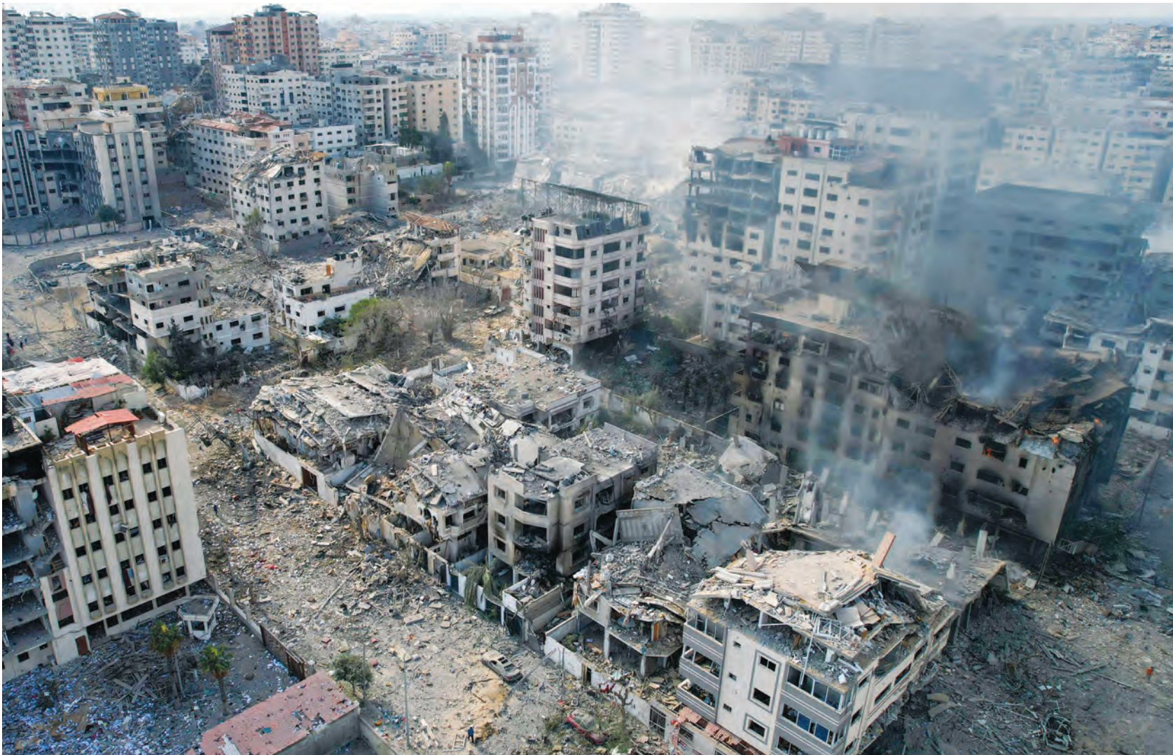
دمار هائل في غزة بفعل القنارات الاسرائيلية

أعلن الجيش الإسرائيلي أمس سيطرته على تخوم غزة مع مواصلة قصف القطاع الخاضع لحصار مطبق، فيما تجاوز عدد القتلى الـ 3 آلاف في الجانبين وبينهم جنود ومقاتلون من "حماس"، في اليوم الرابع منذ أن شنت الحركة هجومها المباغت.