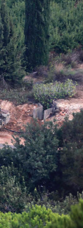
دبابات إسرائيلية على الحدود الجنوبية مع لبنان

وعلى وقعّ جولة جديدة من المواجهات المحدودة شهدتها الجبهة الجنوبية بعد ظهر أمس بعد فترة من الهدوء الحذر قبل الظهر، تلاحت الاتصالات الداخلية في ضوء ما يتلقّاه لبنان من تحذيرات غربية، وتحديداً اميركية، من التداخل في الحرب الدائرة بين الفصائل الفلسطينية وإسرائيل في غرّة وبقية الاراضي المحتلة، فكان لقاء في عين التينة بين رئيس مجلس النواب نبيه بري ورئيس حكومة تصريف الأعمال نجيب ميقاتي، ثم كان لكل منهما لقاء مع السفيرة الاميركية دوروثي شيا التي شرحت ما تقوم به الولايات المتحدة وحلفاؤها بوقف الحرب، وتقلّت تحذيرات اميركية اضافية تدعو الى تحييد لبنان