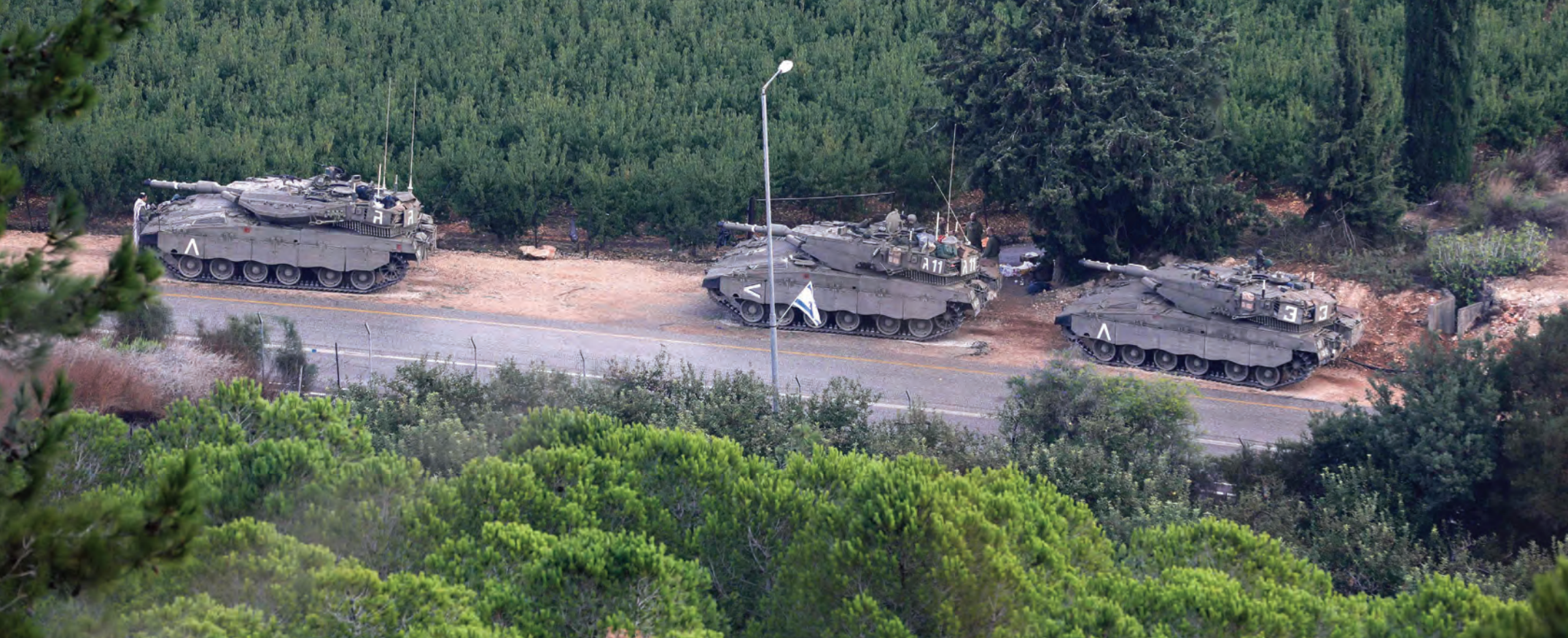
دبابات إسرائيلية على الحدود الجنوبية مع لبنان

وفي التوازي، تمّ اطلاق ثلاث دفعات من الصواريخ في اتجاه الاراضي الفلسطينية المحتلة من منطقة القطاع الغربي. ونقلت وكالة «فرانس برس» عن مصدر عسكري أنّ «ثلاث رشقات من الصواريخ أطلقت من منطقة القبلية في صور، رذّ عليها العدو بالقصف» على بلدات حدودية. وقال «حزب الله» في بيان مساء امس: «رداً على الاعتداءات الإسرائيلية التي استهدفت عدداً من نقاط المراقبة التابعة للمقاومة الإسلامية، قام مجاهدونا مساء هذا اليوم (امس) باستهداف ملاملة إسرائيلية من نوع «زيلداه» عند موقع الصرح غرب بلدة صلحا (المستعمرة المسماة أفيفيم) بصاروخين موجهين وتفتّ إصابتها وتدميرها بالكامل».