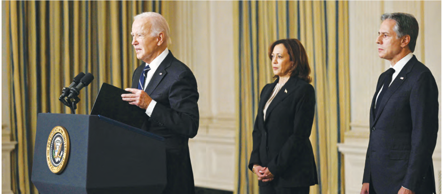
بايدن يخاطب وسائل الاعلام في البيت الأبيض وخلفه وقتت نائبته كامالا هاريس ووزير الخارجية أنتوني بليكن