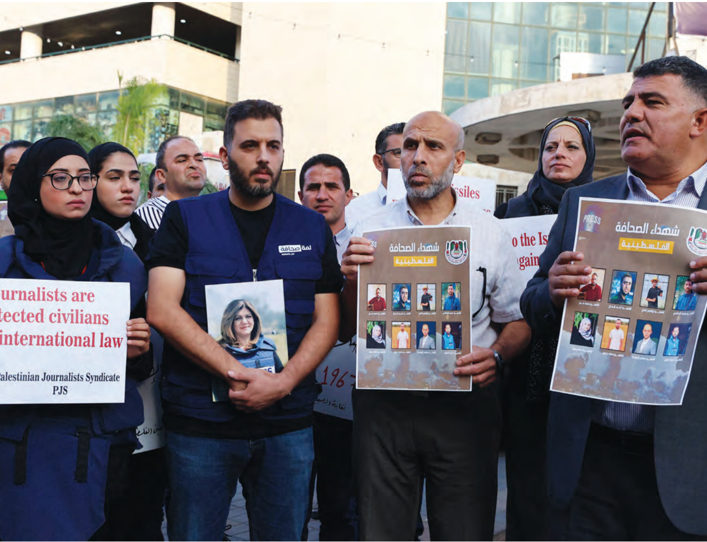
صحافيون فلسطينيون خلال تجمع احتجاجي على مقتل ثلاثة من زملائهم في غزة (إسرائيلية على غزة