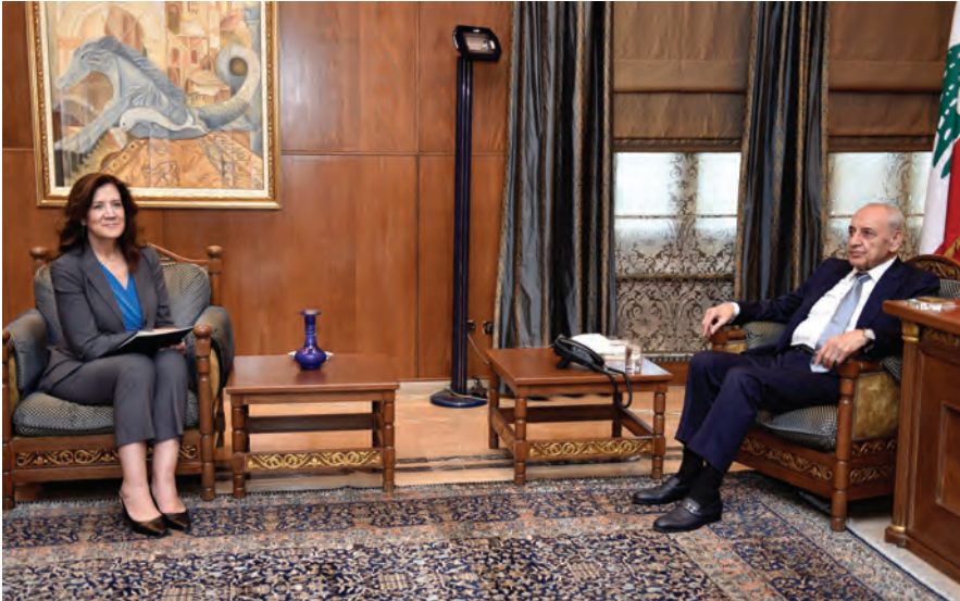
بري مستقبلاً شيّا أمس في عين التينة

عرض التقرير الدوري حول تنفيذ مندرجات قرار مجلس الوزراء رقم 1 تاريخ 2023/09/11 المتعلّق بموضوع النزوح السوري إنّ رئيس مجلس الوزراء الاستاذ نجيب ميقاتي، وعملاً بواجباته الدستورية، وشعوراً منه بالمسؤولية الوطنية، يوجّه هذه الدعوة ويضعها بتصّرف جميع الشادة الوزراء للمشاركة في الجلسة المُقرّرة تلبيةً لنداء الواجب الوطني وهم الحريصون عليه، لاسيّما في ظلّ الظروف الدقيقة التي تمرّ فيها البلاد».