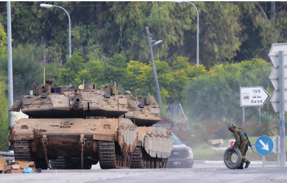
لدى الإسرائيلي ثلاثة خيارات

تسمح للاسرائيلي بمهاجمة ايران، فيبقى جنوب لبنان وغزة، ومن الأسهل اليه غزو غزة من غزو جنوب لبنان اقله برأ.