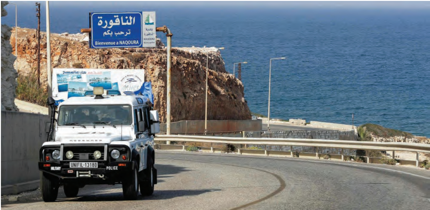
اعمال الحفر مستمرة

وكشف عبود، انّ الوصول الى نقطة الحفر المرجوة بات قريباً، ورغم انّ الطاقم الموجود على المنصّة سيعرف بنتيجة الحفر فوراً، الّا أنّ النتائج الرسمية لن يُعلن عنها قبل نهاية الشهر الجاري، لأنّ هناك مراحل عدة ستقطعها «توتال» قبل الاعلان عن النتائج، فهي ستأخذ