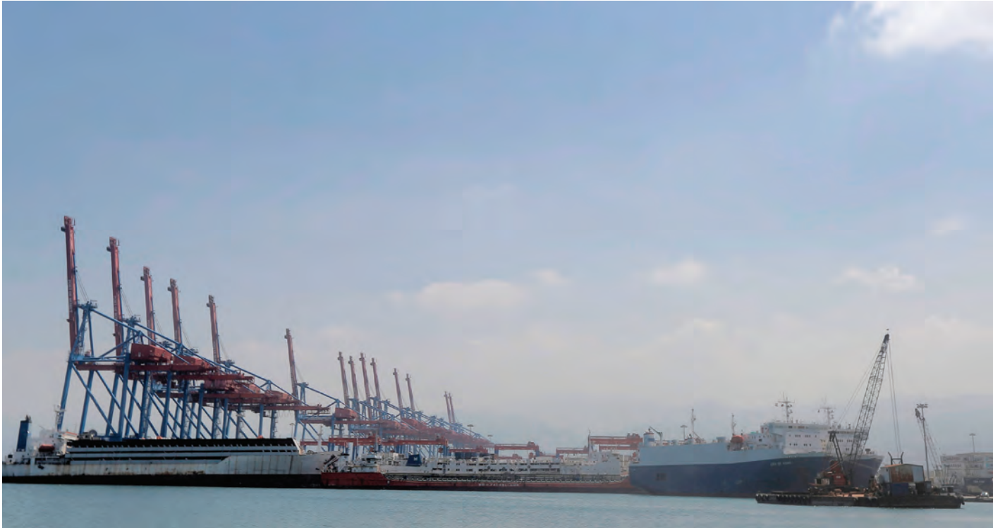
حركة الاستيراد والتصدير تتراجع

أظهرت الأرقام الأولية الصادرة عن الجمارك اللبنانية أنّ إجمالي الواردات بلغ 10.3 مليارات دولار أميركي في الأشهر الثمانية الأولى من العام 2023، ما يشكل انخفاضاً قدره 19.5% من 12.8 مليار دولار في الفترة نفسها من العام 2022؛ بينما بلغ إجمالي الصادرات 1.7 مليار دولار، أي بانخفاض بنسبة 29.4% من 2.4 مليار دولار في الأشهر الثمانية الأولى من العام 2022.