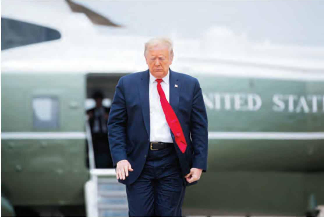
ترامب لدى وصوله أمس الى قاعدة أندروز في ميريلاند

مع الضحايا: «ما حدث للعالم وبلدنا أمر محزن للغاية، كل هذه الوفيات... إنه لأمر محزن للغاية للعديد من الأسر التي عانت كثيراً». وأضاف: «كان بإمكانهم وقف الفيروس في الصين من حيث أتى. لكن ذلك لم يحدث».