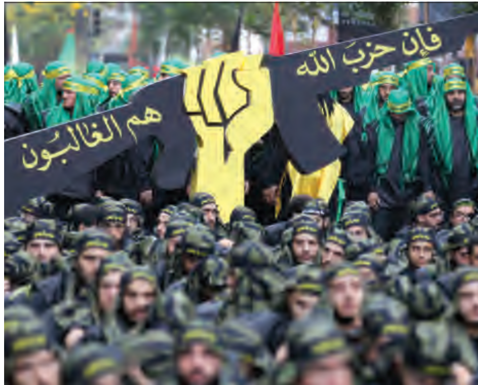
انتحار الدور الإيراني لا يعود فقط إلى محاصرة واشنطن لطهران، بل يعود إلى سوء إدارة هذا الفريق

المنضوية في المحور الإيراني أدّت إلى انتهاك العواصم العربية الأربع التي دخلت في مراحل الانهيار والفوضى، وبالتالي بات يرتبّب على كل دولة من هذه الدول، باستثناء سوريا التي أصبحت تحت وصاية روسيا، أن تعيد ترتيب أوضاعها الداخلية تحجّياً للانهيار الشامل والفوضى، وهذا ما يفرض انكفاء او انتفاء دور «حزب الله» الإقليمي، وانتقاله من خطوة تراجعية إلى أخرى خوفاً من انقراط الدولة التي يمسك بقرارها الاستراتيجي، خصوصاً انه يخوض أساساً مواجهة لا يتقنها، وقد اعترف أخيراً بأنه أهمل مقاربة الواقع المالي في لبنان محالو بذلك أن يرفع عن نفسه مسؤولية الانهيار الحاصل، فيما أحد الأسباب الرئيسية للانهيار يكمن في إمساكه بمفاصل السلطة.