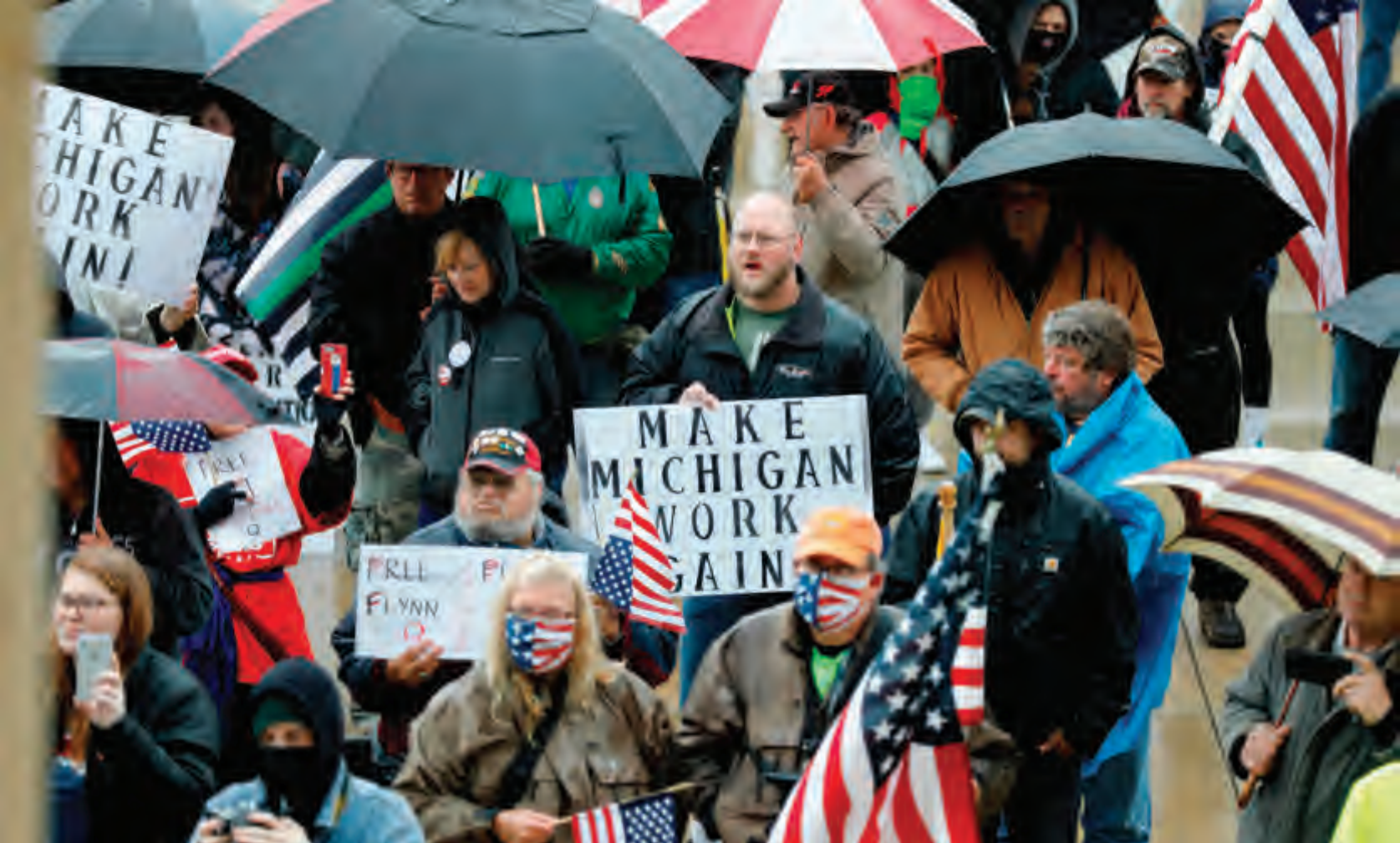
أميركيون يتظاهرون في مدينة لانسينغ في ميشيغن مطالبين برفع إجراءات منع التجول بسبب "كورونا" (أ ف ب)

وأكد رئيس الوزراء إدوار فيليب، الذي تواصل أمس مع رئيس مجلس إدارة الشركة، سيرج وينبرغ، أنّ «الوصول العادل للجميع إلى اللقاح أمر غير قابل للتفاوض».