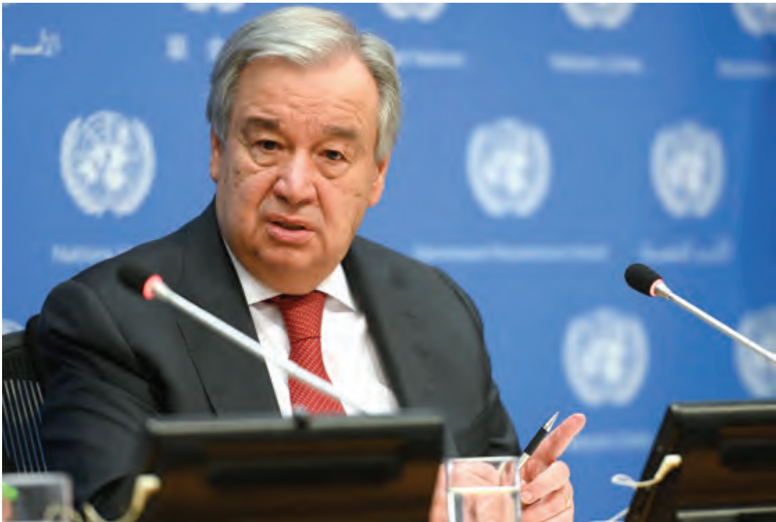
لم يكن ممكناً تلفيح أكثر من ١١٧ مليون طفل في ٣٧ دولة ضد الحصبة خلال شهر بسبب الوباء

تفشي الوباء. وأوضحت كيستيل أنّ دراسات أخرى بيّنت أنّ معدل انتشار الاضطراب العقلي في خضمّ الأزمة كان بنسبة 60 ٪ في إيران و45 ٪ في الولايات المتحدة. وأشارت إلى دراسة كندية أظهرت أنّ ما يقرب من نصف العاملين في مجال الرعاية الصحية قالوا إنهم يحتاجون إلى دعم نفسي.