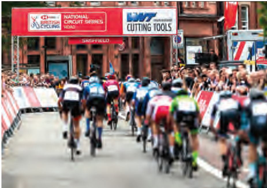
من جائزة بريطانيا ٢٠١٩

وجاء في بيان المنظمين أيضاً، «في شتى أنحاء المملكة هناك شكوك كبيرة حول إمكانية إقامة مناسبات وتجمّعات عامة كبيرة مثل سباق بريطانيا للدراجات حتى أيلول، وفي ظل استمرار تطبيق قواعد التباعد الاجتماعي وعدم توفر لقاح للفيروس، فإنّ صحة وسلامة الجمهور لا بدّ أن تأتي على رأس الأولويات». وأردف البيان: «وبتأجيل تطبيق مسار السباق الذي كان مقرّراً في العام الحالي إلى أيلول 2021، فإنّه سيكون بوسع شركائنا ومنشأتنا الاستعداد للسباق طوال 12 شهراً كاملة، حتى تسمح الظروف بمشاركة الجمهور عبر مراحل السباق الثماني». وتحدّد مبدئياً إقامة السباق ما بين الخامس و12 أيلول 2021.