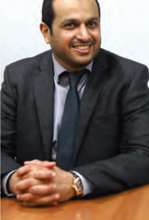
الدعوة تعبر عن جوهر التسامح والتلاقي

وعكار والبقاع وسيبوقّر 60 ألف وجبة إفطار ساخنة، ليكون عوناً للأسر المحتاجة والأكثر تضرراً وفقراً، بالتعاون مع جمعيات «الغنى الخيرية» و«أجيالنا» و«عكارنا» وصندوق الزكاة في البقاع.