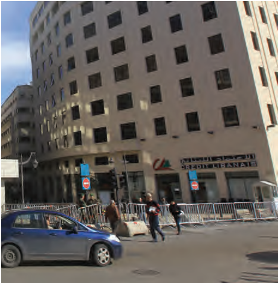
إنقاذ القطاع بالتعويم

* أستاذة محاضرة - رئيسة قسم القانون الخاص في كلية الحقوق - الجامعة اللبنانية