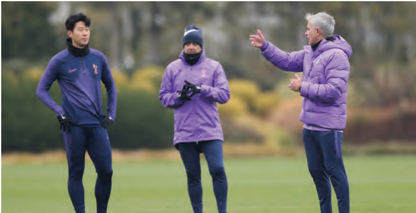
مورينيو في تدريبات توتنهام سابقاً

أُكِّد مدرب توتنهام البرتغالي جوزيه مورينيو أنه متلهّف لاستئناف النشاط في الدوري الإنكليزي الممتاز، على الرغم من تزايد القلق حول مخظطات استكمال موسم 2019-2020 بسبب تفشي فيروس كورونا.