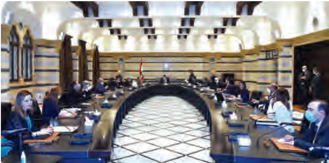
دياب مترئساً جلسة مجلس الوزراء أمس في السراي الحكومي

على طلب وزارة الطاقة والمياه للاحية التفاوض على التفاهمات مع الشركات المهتمة، استناداً الى مذكرة التفاهم المعدّة من قبل الوزارة بعد إدخال بعض التعديلات عليها، والمُرفقة بهذا القرار، والتي تعتبر جزءاً لا يتجزّأ منه، ورفع تقرير بالنتيجة الى مجلس الوزراء لكي يُصار الى تطبيق الخطة، بدءاً بالزهراني. وشرحت أنّ «أولوية التفاوض على التفاهمات مع الشركات المهتمة بموضوع ملف الكهرباء ستبدأ في مرحلة أولى من معمل الزهراني، يليها دير عمار، وإذا اضطر الأمر سيتم البحث في مراحل أخرى». وأشارت الى أنّه «تمّ التباحث مع حاكم مصرف لبنان رياض سلامة لضخ الدولار في الاسواق للجم ارتفاعه، فلم يتمّ هذا الأمر، بعد أن تمّ الاتفاق حوله في آخر اجتماع جمع رئيس الحكومة ووزير المال بسلامة». وبالنسبة الى آلية التعيينات، قالت نجد إنّ رئيس الجمهورية العماد ميشال عون يرى «أنّه دستورياً على الوزير المختص رفع الأسماء إلى مجلس الوزراء، وهذا لا يعني أنّ الآلية مُلغاة أو لا تُطبق، بل هي اختيارية، والتعيينات تراعي مبدأ الموضوعية وتحتاج إلى آلية معينة، وهي مراعاة المساواة عند فتح باب الترشيح للجميع والعدالة عند الاختيار بحسب الكفاءة والجدارة».