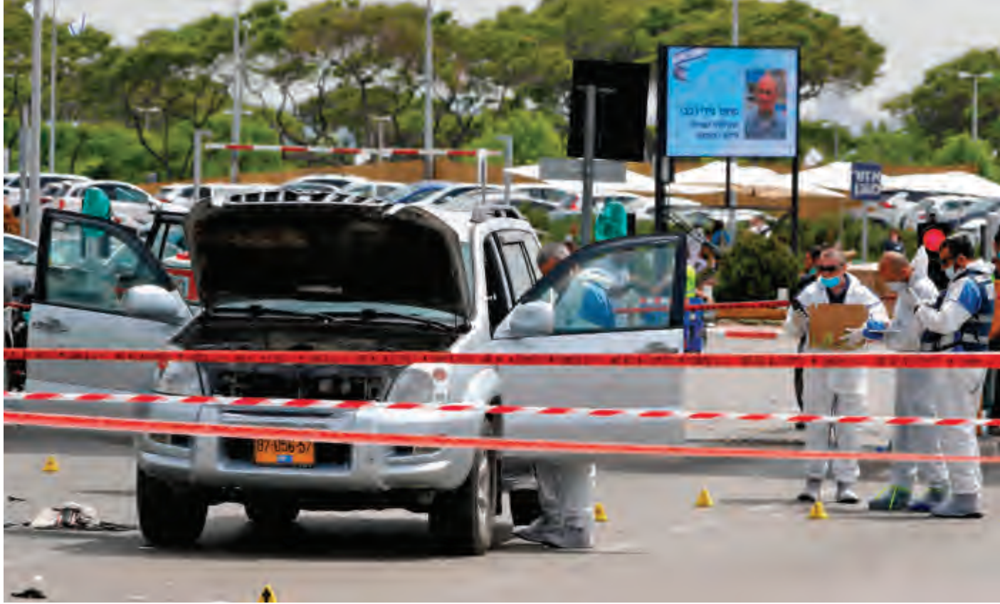
عناصر من الشرطة الاسرائيلية تتفقد مكان حادثة الدهس (أ ف ب)

مقتل فلسطيني بعد محاولة دهس جنود إسرائيليين جنوب الضفة الغربية