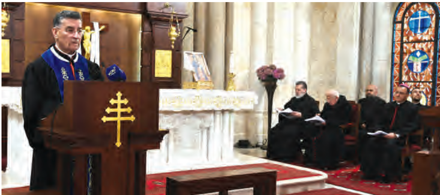
الراعي مترئسا الصلاة التضامنية أمس في الصرح البطريركي في بكركي (١)

إعتبر رئيس الجمهورية العماد ميشال عون، دعوة "اللجنة العليا للأخوة الإنسانية" تكريس 14 أيار يوماً للصلاة والصوم والدعاء وأعمال الخير كل في مكانه، وبحسب دينه أو معتقده، ليحتمي الله البشرية من خطر وباء كورونا، مبادرة نابعة من القلب والضمير، وهي تأتي من صلب أهداف المبادرة التي أطلقها الرئيس وأقرتها الجمعية العامة للأمم المتحدة، والقاضية بإنشاء "أكاديمية الإنسان للتلاقي والحوار" في لبنان، للمساهمة في بناء حضارة إنسانية قائمة على قبول الآخر.